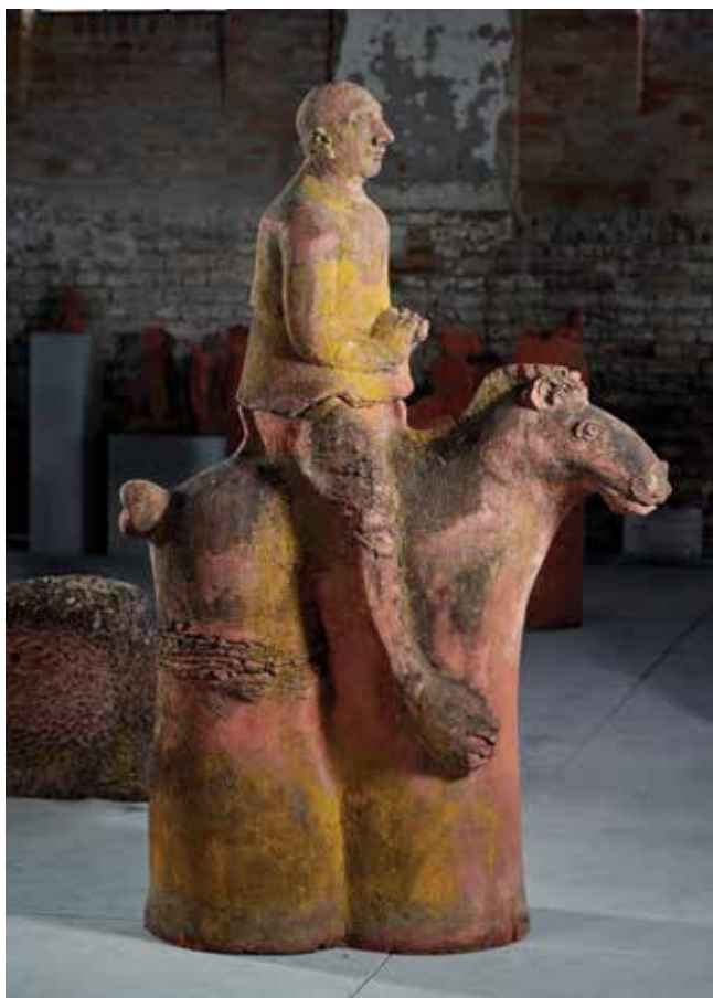
8. Antun Babić, Veliki jahač (Konjanik) , 1986., Muzej Terra, Kikinda, terakota, 190 × 124 × 65 cm, inv. br. 18603 Antun Babić, The Large Rider (Horseman) , 1986

skulptura muški je torzo malih dimenzija. Skulpture nastale na Simpoziju Terra srodne su ostatku njegova opusa. Figuraciju pojednostavljuje i reducira do elementarnih oblika zatvorenih volumena i arhaične snage. Na Terri je nastala Glava velikih dimenzija (visine 137 cm) koja se do listopada 2015. godine nalazila u starom dijelu dvorišta Ateljea Terra kad je dopremljena u Hrvatsku. 49 Nakon što je ispunio obveze prema organizatoru izvedbom i donacijom triju skulptura, izveo je Glavu koja je bila njegovo vlasništvo. Donirao ju je Muzeju likovnih umjetnosti u Osijeku te je postavljena ispred muzeja. Za izlaganje na Babićevoj monografskoj izložbi 50 u Muzeju likovnih umjetnosti u Osijeku 2015. posuđen je Veliki jahač (Konjanik) . 51 Pokretač kolonije u Iloku i sudionik brojnih kiparskih kolonija govori o specifičnostima kikinjskog simpozija: »Osnova svake takve akcije je istovremeno okupljanje umjetnika na istom mjestu, zajednička radionica u kojoj se dolazi do nekih rezultata koji su nedostupni kod zatvaranja u vlastiti atelje. Kikinjska 'Terra' osobena je na više načina. Prvo, radnim prostorom, zatim mogućnošću da se realiziraju ideje koje zahtijevaju veliki format. To je svojevrsan eksperimentalni laboratorij, u kom je moguće provjeriti, upotpuniti i proširiti svoja ranija saznanja. Tome doprinosi i tijesna veza Simpozija i IGM 'Toza Marković' gdje uz zajednički ljudski rad skulptura prolazi istovremeno