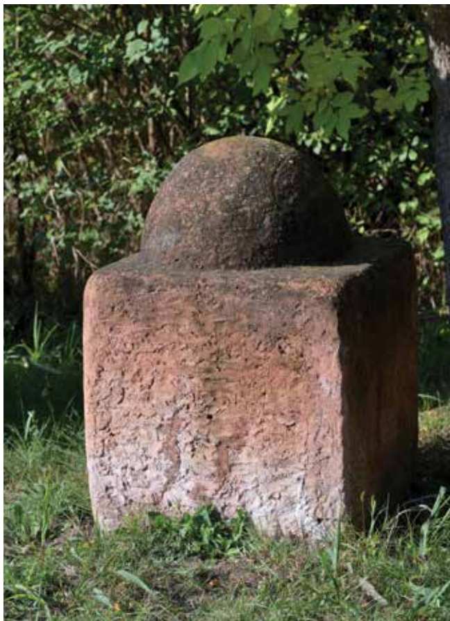
11. Ivan Kožarić, Sjećanje na poplavu , 1990., Muzej Terra, Kikinda, terakota, 62 × 63 × 87 cm, inv. br. 29020 Ivan Kožarić, Remembering the Flood , 1990