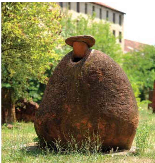
6. Miro Vuco, Miroslav Krleža , 1985., terakota, Muzej Terra, Kikinda, 151 × 125 × 97 cm, inv. br. 18510