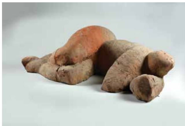
9. Kosta Angeli Radovani, Velika žena na lijevom boku , 1987., Muzej Terra, Kikinda, terakota, 33 × 110 × 56 cm, inv. br. 18702

skulptura muški je torzo malih dimenzija. Skulpture nastale na Simpoziju Terra srodne su ostatku njegova opusa. Figuraciju pojednostavljuje i reducira do elementarnih oblika zatvorenih volumena i arhaične snage. Na Terri je nastala Glava velikih dimenzija (visine 137 cm) koja se do listopada 2015. godine nalazila u starom dijelu dvorišta Ateljea Terra kad je dopremljena u Hrvatsku. 49 Nakon što je ispunio obveze prema organizatoru izvedbom i donacijom triju skulptura, izveo je Glavu koja je bila njegovo vlasništvo. Donirao ju je Muzeju likovnih umjetnosti u Osijeku te je postavljena ispred muzeja. Za izlaganje na Babićevoj monografskoj izložbi 50 u Muzeju likovnih umjetnosti u Osijeku 2015. posuđen je Veliki jahač (Konjanik) . 51 Pokretač kolonije u Iloku i sudionik brojnih kiparskih kolonija govori o specifičnostima kikinjskog simpozija: »Osnova svake takve akcije je istovremeno okupljanje umjetnika na istom mjestu, zajednička radionica u kojoj se dolazi do nekih rezultata koji su nedostupni kod zatvaranja u vlastiti atelje. Kikinjska 'Terra' osobena je na više načina. Prvo, radnim prostorom, zatim mogućnošću da se realiziraju ideje koje zahtijevaju veliki format. To je svojevrsan eksperimentalni laboratorij, u kom je moguće provjeriti, upotpuniti i proširiti svoja ranija saznanja. Tome doprinosi i tijesna veza Simpozija i IGM 'Toza Marković' gdje uz zajednički ljudski rad skulptura prolazi istovremeno