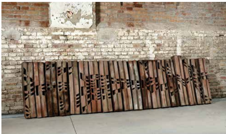
10. Stevan Luketić, Bez naziva , 1988., Muzej Terra, Kikinda, terakota, 126 × 443 × 12 cm, inv. br. 18822