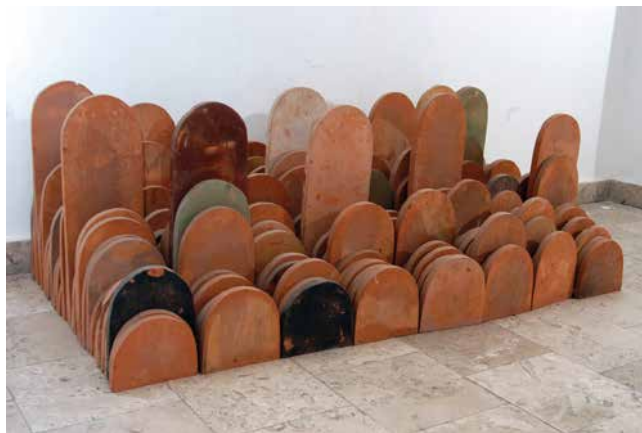
4. Tomislav Kauzlarić, Bez naziva , 1984., Muzej Terra, Kikinda, terakota, 64 × 144 × 58 cm, inv. br. 18402 Tomislav Kauzlarić, Untitled , 1984

Branko Ružić (Slavonski Brod, 1919. – Zagreb, 1997.) od kiparskih je početaka radio u raznim materijalima (drvo,