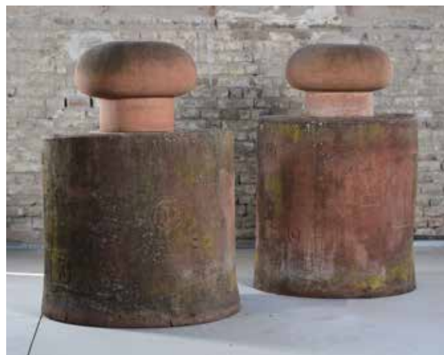
7. Ante Marinović, Kraljevski par , 1985., Muzej Terra, Kikinda, terakota, 159 × 262 × 115 cm, inv. br. 18506

Miro Vuco (Vojnić Sinjski, 1941.) sudjeluje na 4. Simpoziju Terra (1985.) te izvodi skicu i kip Miroslava Krleže 39 (visine 151 cm). Lik Miroslava Krleže bio je česta tema njegova likovna opusa. Krležu je prikazao redukcijom elemenata, naglasivši dva atributa koja su ga određivala – kaput i šešir (sl. 6). Kaput obavija korpulentno tijelo poput kugle, a na tijelu je mala kugla glave na kojoj je zataknut plitak šešir. Na Terri nastaje kiparska instalacija Cipelice , 40 novi oblik komentara stvarnosti. Koristi podatnost materijala te modelira razne vrste muških i ženskih cipela istrošenih i deformiranih od nošenja, snažne ekspresije. Nakon povratka s Terre nastavlja raditi u terakoti u zagrebačkoj Ciglani. Naime, u 42. godini života prestaje raditi poliesterom zbog njegove toksičnosti i