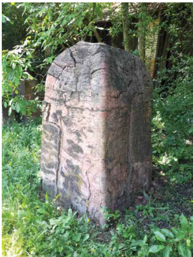
1. Peruško Bogdanić, Veliki prizor , 1982., Muzej Terra, Kikinda, terakota, 173 × 107 × 97 cm, inv. br. 19922 Peruško Bogdanić, Big Scene , 1982