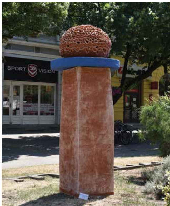
13. Tamara Sekulić, Allium , 2020., Muzej Terra, Kikinda, terakota, 264 × 107 × 96 cm, inv. br. 52004 Tamara Sekulić, Allium , 2020

je izvedba skulptura u terakoti velikih formata i povezivanje geometrijskih i organskih formi.