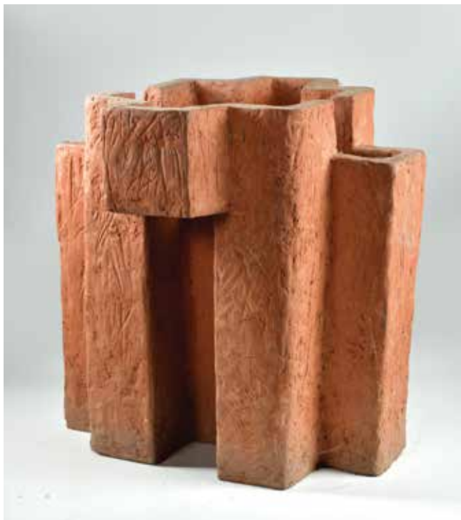
3. Dora Kovačević, Grad , 1983., terakota, Muzej Terra, Kikinda, 48 × 46 × 45 cm, inv. br. 18313 Dora Kovačević, The City , 1983

linija kako bi se po njegovoj zamisli rezale različite dužine crepova. To govori o izvrsnoj suradnji tvornice i umjetnika u prvim godinama postojanja simpozija.