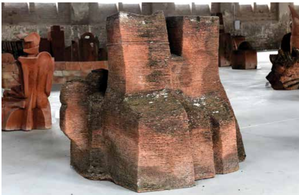
5. Branko Ružić, Mačke u šetnji III , 1984., Muzej Terra, Kikinda, terakota, 127 × 147 × 130 cm, inv. br. 18415 Branko Ružić, Strolling Cats III , 1984

bronca, gips, glina), a nakon sudjelovanja na 3. Simpoziju Terra (1984.) uz drvo najčešće koristi terakotu. Dotad je izveo samo nekoliko radova u tom materijalu. 32 Odgovarala mu je kakvoća oba materijala i mogućnost da površina djeluje sirovo i neobrađeno. Govori o materijalima koje koristi: »Ideja se može useliti u svaki materijal. Pod određenim okolnostima i ja prelazim u nove serije, ovisno o materijalu. Tako sam se odlaskom u Kikindu udomio u terakoti, a odlaskom u Italiju u kamenu.« 33 Tijekom boravka na simpoziju, uz obvezne tri skulpture, organizatoru je poklonio dodatne tri skulpture, a prema sjećanju Slobodana Kojića, u Kikindi je izradio oko 120 skulptura, koje je ponio sa sobom. 34 U zbirci Muzeja Terra nalaze se dvije monumentalne skulpture ( Bijela ruka i Mačke u šetnji III , visine 147 cm, sl. 5) 35 te četiri skulpture