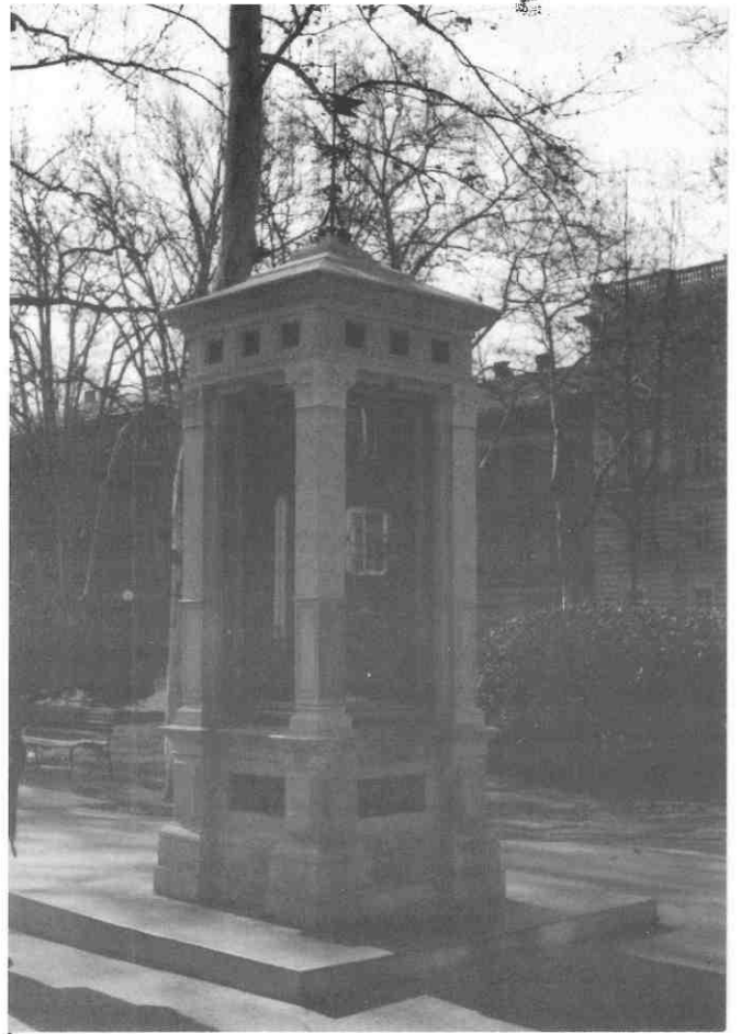
Herman Bollé, Meteorološki stup na Zrinjencu, Zagreb 1884. Herman Bollé, The meteorological information station, Zagreb 1884