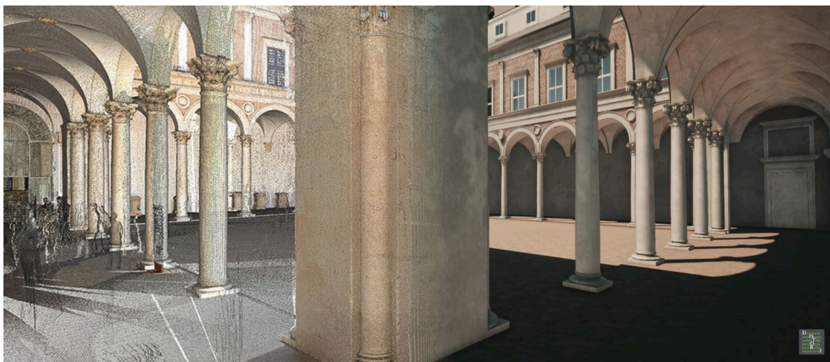
Lauranino dvorište u duždevoj palači u Urbinu: od oblaka točaka do informacijskog modela povijesne građevine

Dr.sc. Ramona Quattrini će predstaviti više primjera studija iz područja digitalne kulturne baštine, objašnjavajući izniman potencijal virtualnog faksimila u svrhu dokumentiranja i očuvanja memorije kako bi se osigurala zaštita kulturne baštine. Pregledom glavnih tehnika i metoda digitalizacije povijesne arhitekture, skulptura, slika i arheološke baštine ukazat će na različite načine primjene 3D digitalnih modela. Poblježe će se analizirati rezultati dobiveni krosdisciplinarnom suradnjom kao što su aplikacije namijenjene muzejima temeljene na znanstvenom pristupu, 3D modeli namijenjeni povijesnoumjetničkim istraživanjima i edukaciji (HBIM) te istraživački alati i baze podataka za restauriranje, projektiranje, gamifikaciju i aplikacije razvijene za turizam (AR / VR).