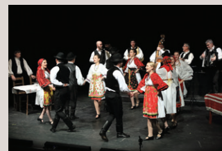
Folklorni ansambl „Tanac“