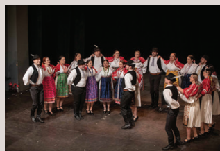
Ogranak Seljačke sloge Buševac