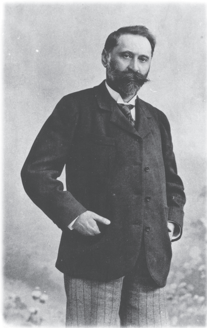
Fototeka Muzeja grada Zagreba