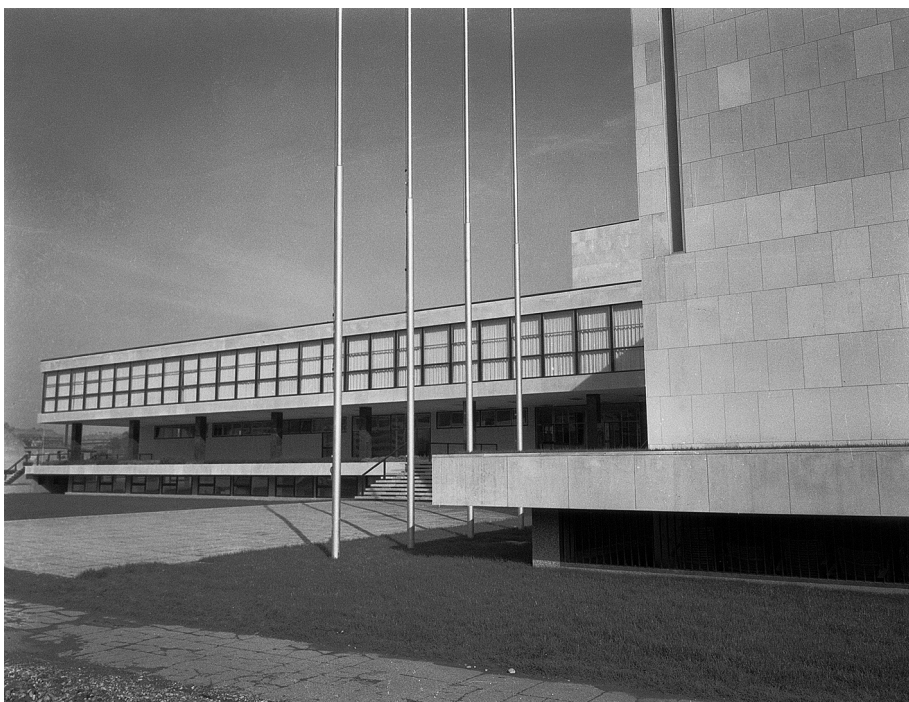
◀/▲ Pučko otvoreno učilište u Zagrebu Building of the Public Open University in Zagreb

sličnih aktivnosti. Primjerice, u posljednjem desetljeću Institut je organizirao tri nacionalna kongresa povjesničara umjetnosti. Istodobno, neprestano se povećava i sudjelovanje znanstvenika Instituta u visokoškolskoj nastavi odnosno u doktorskim studijima na svim hrvatskim sveučilištima na kojima se predaje povijest umjetnosti.