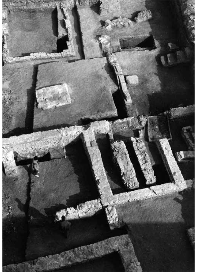
4. Sisak, arhitektura dijela gradske četvrti ( insulae ) iz razdoblja 2. – 4. st., otkrivena pri zaštitnim istraživanjima 1990. u Ulici Stjepana i Antuna Radića