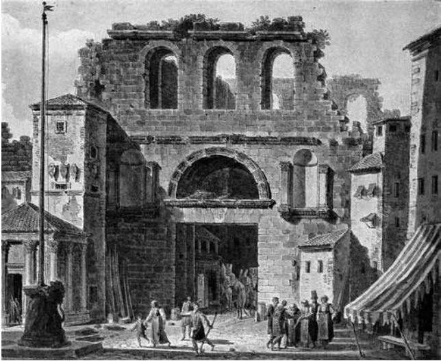
2. Split, Zlatna vrata, 1782. (L. F. Cassas)