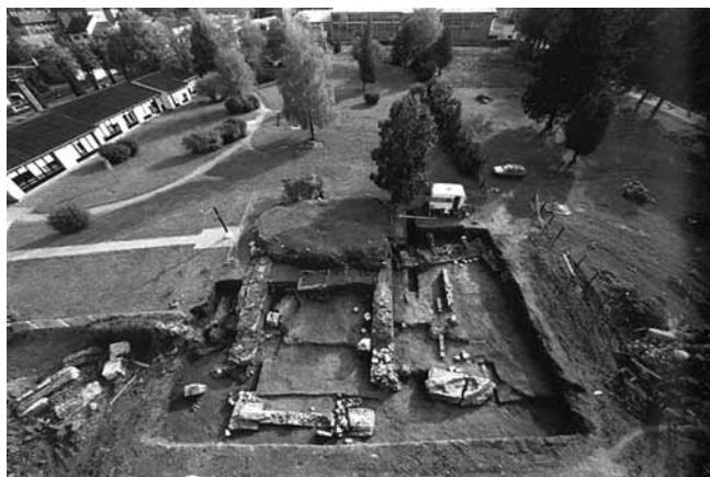
6. Sisak, lokalitet Sv. Kvirin