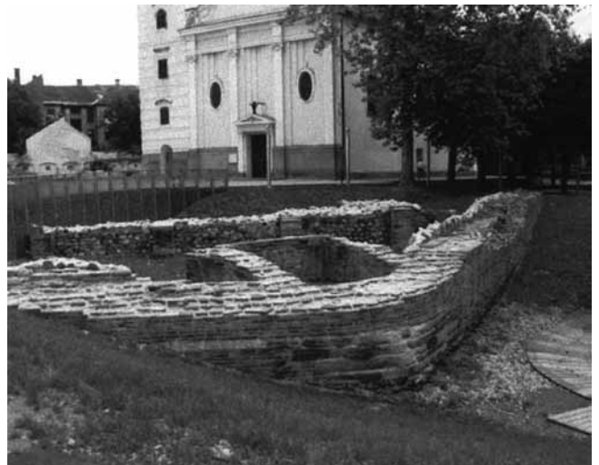
5. Sisak, župna crkva Uzvišenja sv. Križa, Siscia in situ , 1. – 4. st.