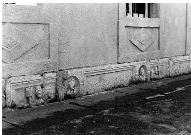
7. Sisak, ostatci sarkofaga pronađeni početkom 19. st. te odmah uzidani u građansku kuću u Lađarskoj ulici