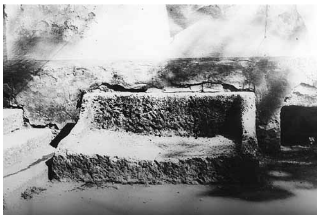
8. Sisak, devastirani sarkofag u dvorištu privatne kuće