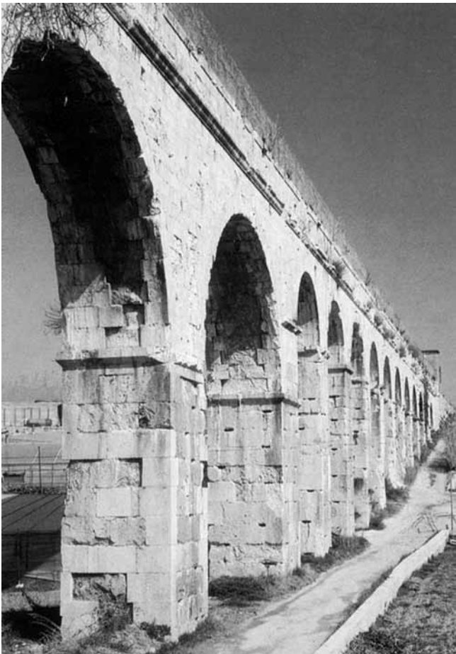
3. Split, Akvedukt