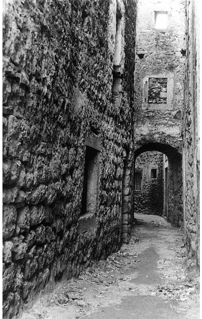
3. Vodice, Kinkležova ulica, prva polovina 20. st.