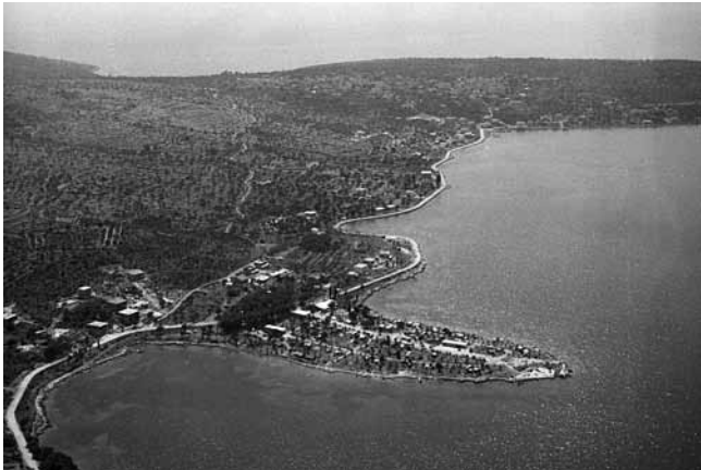
8. Uvala Saldun 1960-ih godina