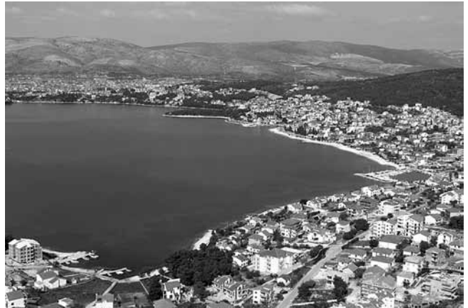
9. Uvala Saldun danas