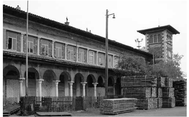
6. Sušački kolodvor na Brajdici, srušen 2008.