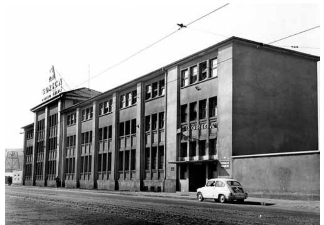
4. Tvornica »Gorica« – negdašnja zgrada rafinerije i pecare tvornice »Vladimir Arko«, Šubićeva ulica, Zagreb, oko 1970.