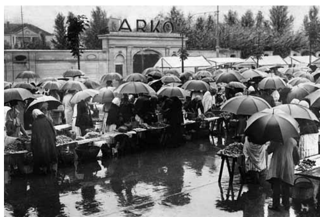
9. Pogled na Medašni (Kvaternikov) trg i ulaz u vrt poslovnice i rezidencije Vladimira Arka, oko 1930.