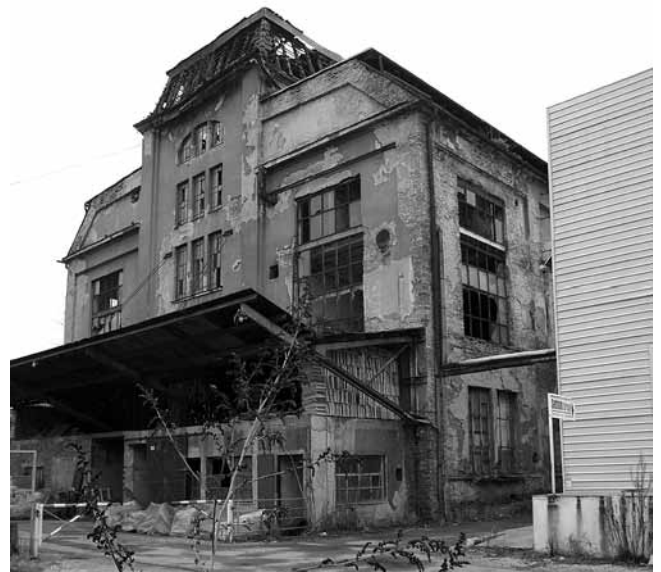
5. Ignjat Fischer, zgrada tvornice pjenice, 2010.