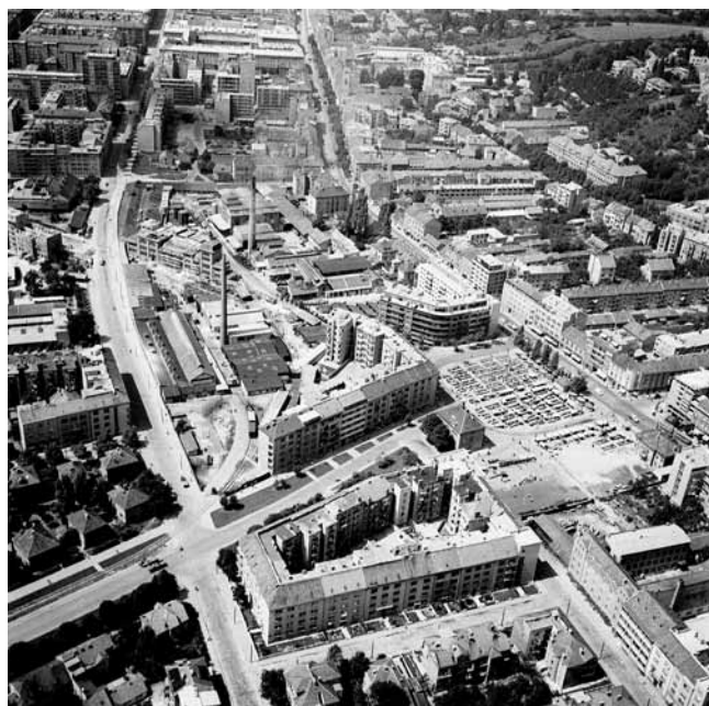
7. Pogled na negdašnje tvornice »Vladimir Arko«, »Zagrebačku tvornicu bačava« i »Tvornicu pocaklene robe Arko-Email« (Gorica), oko 1960. (privatna zbirka, Zagreb)