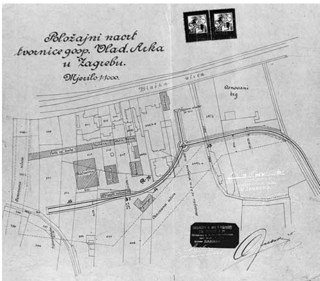
2. Položajni nacrt tvornice »Vladimir Arko«, Zagreb, 1918.