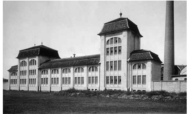
3. Ignjat Fischer, zgrada rafinerije i pecare, Šubićeva ulica, Zagreb, 1918. – 1921.