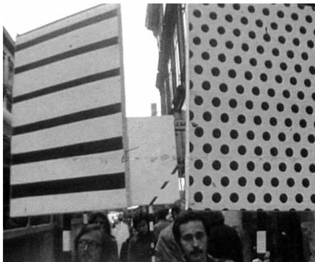
5. Grupa TOK, Demonstracija (Crte-Točke) , 1972. (Zbirka Marinko Sudac, Zagreb)