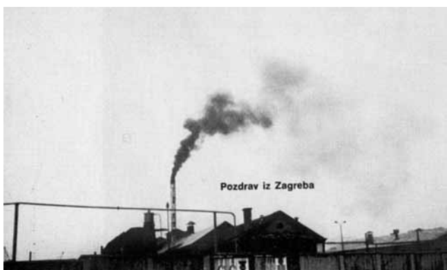
4. Grupa TOK, Pozdrav iz Zagreba , 1972. (Zbirka Marinko Sudac, Zagreb)