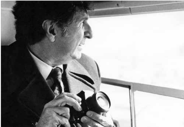
1. Bernardo Bernardi, arhitekt, dizajner i fotograf, 1921. – 1985. (Hrvatski muzej arhitekture HAZU, Osobni arhivski fond Bernarda Bernardija, dalje: HMA HAZU, OAF BB)

Usp. Finska primjenjena umetnost, katalog izložbe, Beograd–Zagreb–Ljubljana, 1966.