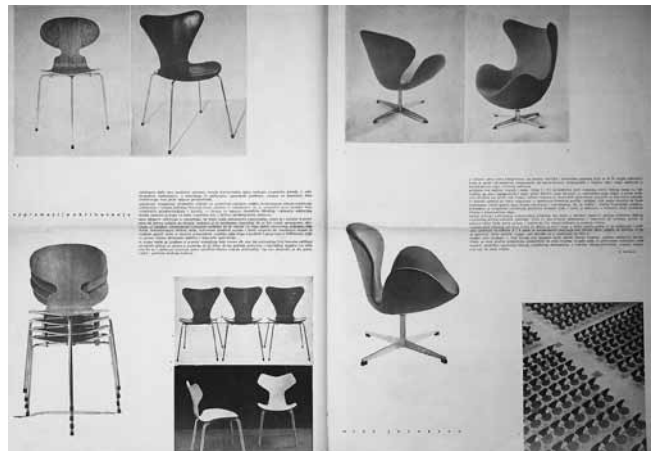
8. Bernardo Bernardi, Supremacija oblikovanja, Čovjek i prostor , 114, 1962.