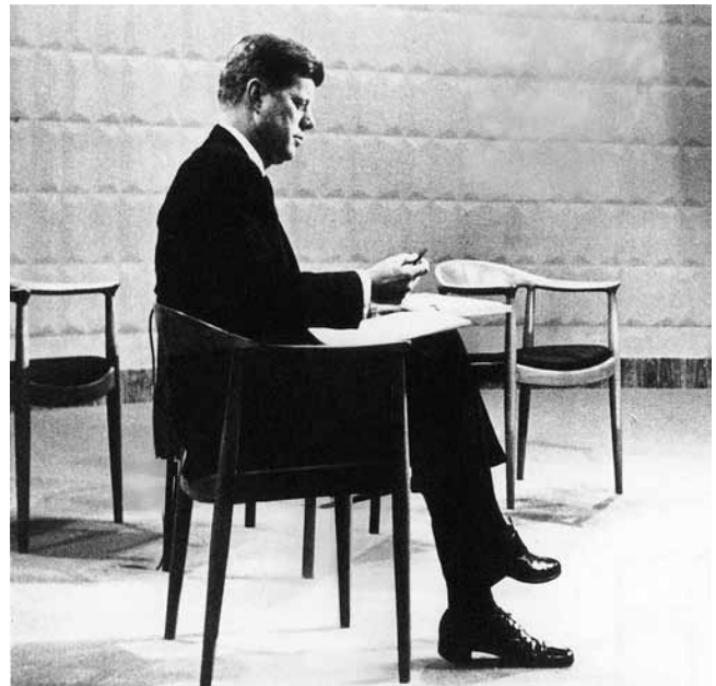
4. J. F. Kennedy u studiju CBS Television opremljenom Wegnerovim sjedalicama »Den runde stol« iz 1949.