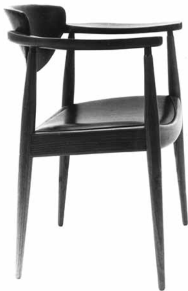
5. Bernardo Bernardi, polunaslonjač s rukonaslonom u proizvodnji Drvne industrije Vrbovsko, 1961.