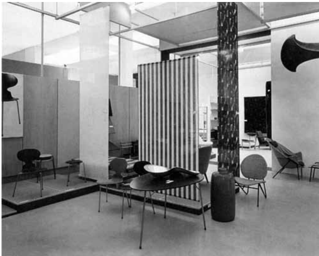
2. Danska izložba na 10. milanskom triennaleu, 1954. (Scandinavian Design Beyond the Myth. Fifty Years of Design from the Nordic Countries, Stockholm 2003.)