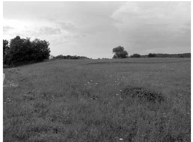
6. Poljangrad