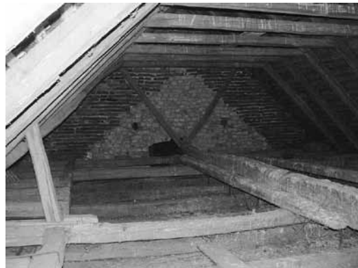
2. Kapela sv. Klare, krovništvo