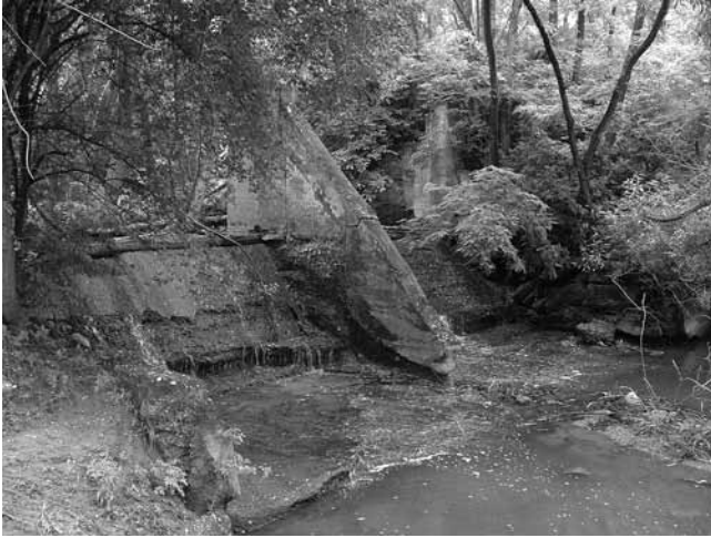
3. Pavetićevo mlin