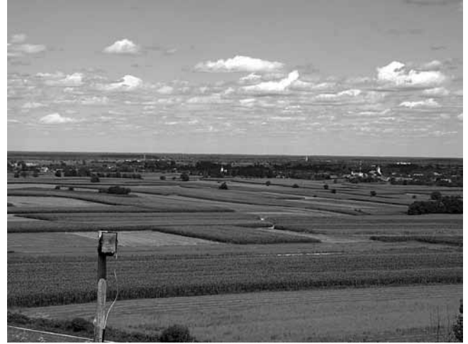
5. Pogled s Prkosa na Sv. Klaru (snimio V. Jukić)