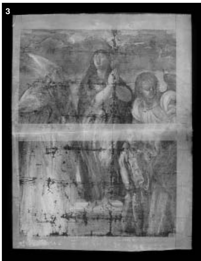
3. RTG snimak slike 4. Detalj s rukom sv. Vlaha uz lijevi rub formata. 5. Mikro-presjek uzorka s nebeske pozadine uz desni rub formata dokumentira tanki sloj retuša i starog laka na plavom slikanom sloju s krupnim kristalima azurita.