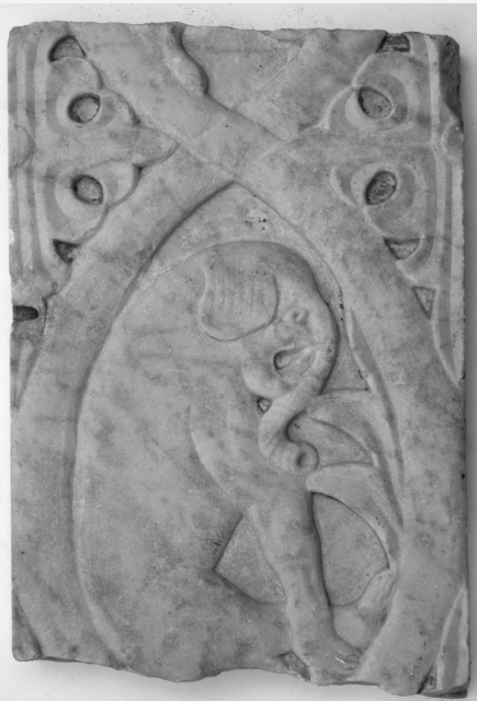
Ulomak pluteja iz Daruvara, 11. st., Gradski muzej Bjelovar

liježu diktatu suvremenih teritorijalno-političkih struktura. Konačno, može se reći da odabrani teritorij približno odgovara dvjema kasnoantičkim provincijama formiranim u južnoj Panoniji: Pannonia Savia i Pannonia Secunda .