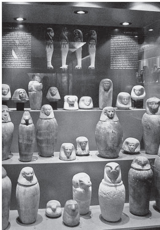
↑ Poklonstvo množini predmeta u postavu Egiptanske zbirke u Arheološkom muzeju u Zagrebu

katu na zidu Gliptotekina parka skulptura - crveni kvadrat izmaknut na rub sivog pravokutnika i nečitljiv naslov na uskoj horizontalnoj sivoj jezgri. Dakle, na zidu znak za izložbu koja je i sama znak.