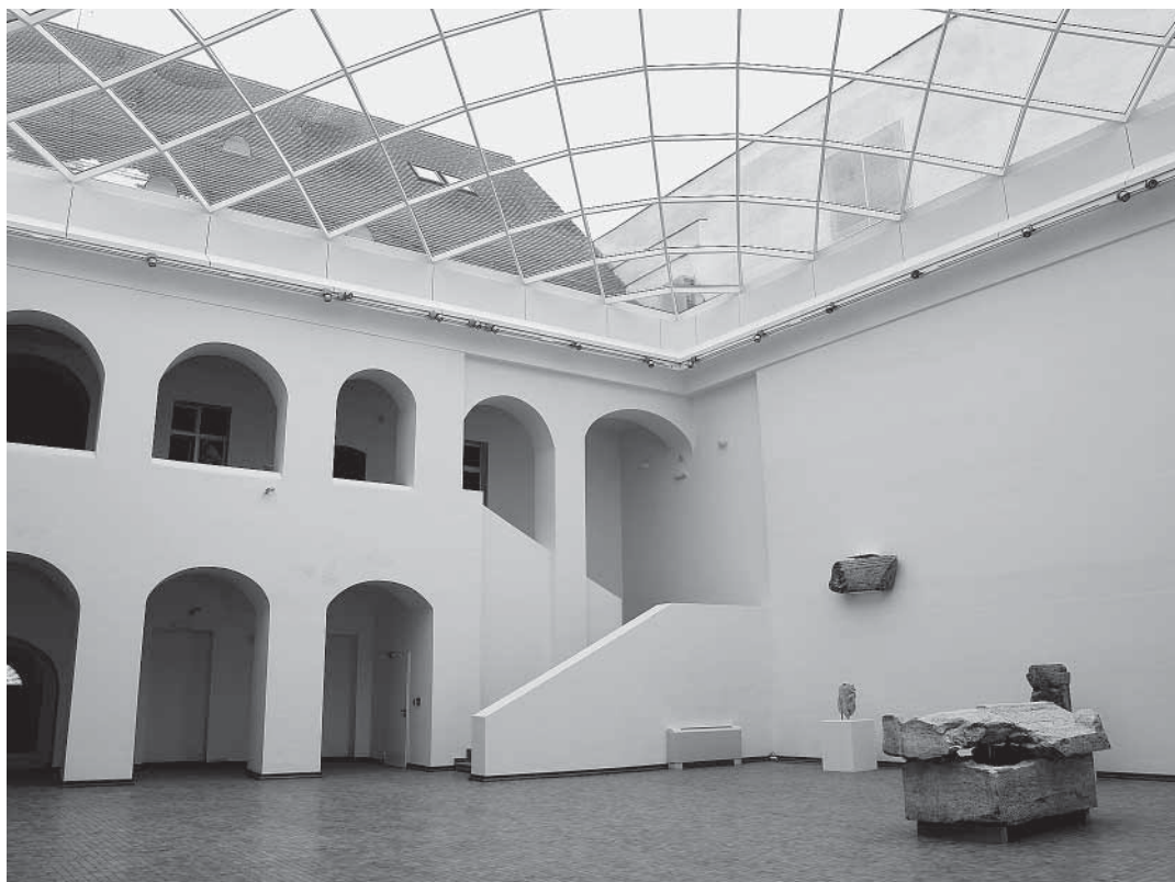
↑ Arheološki muzej u Osijeku

GLAVNI PROJEKTANT ZGRADE MUZEJA: Branko Siladin