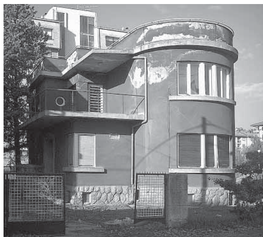
↑ Vila Gras, Dudovec 57, Zagreb, 2006.

U rješenju o njezinoj preventivnoj zaštiti donesenom 30. prosinca 2004. (koje se izdaje na 3 godine) stoji: “Slobodnostojeća, jednokatna vila Gras, građena je tridesetih godina 20. st. (oko 1936.?), prema projektu i u izvedbi ovlaštenog graditelja Stanka Horvata. Smještena je na parkovno uređenoj, relativno uskoj parceli, s istoka i zapada omeđenju cestama; trostrano je orijentirana, s glavnim ulazom i balkonima prema jugu. Izgrađena je na međi, te sa sjeverne strane potpuno zatvorena. Modernog koncepta, razvedenog je volumena, stereometrijski komponirana, skladnih proporcija s krovnom terasom nad cijelim objektom. Funkcionalna prostorna organizacija s centralno smještenim prostranim hallom s trokrakim stubištem; salonom, radnom sobom, kuhinjom s gospodarskim prostorijama u prizemlju, te spavaonom na katu. S nivoa prvog kata vanjsko stubište vodi na krovnu terasu. U oblikovnom smislu karakterizira ju zaobljena zidna ploha salona u prizemlju i sobe na katu – rastvorena kon-