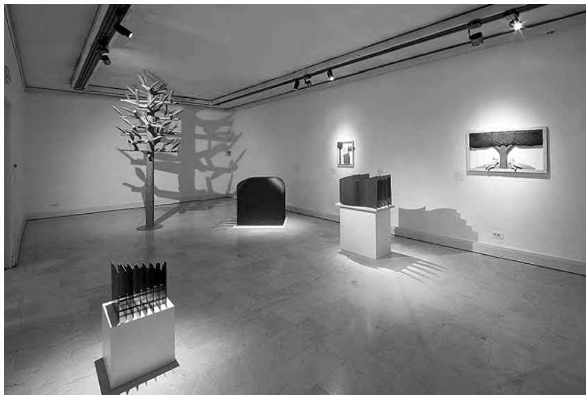
© S postava izložbe, FOTO G. Vranić