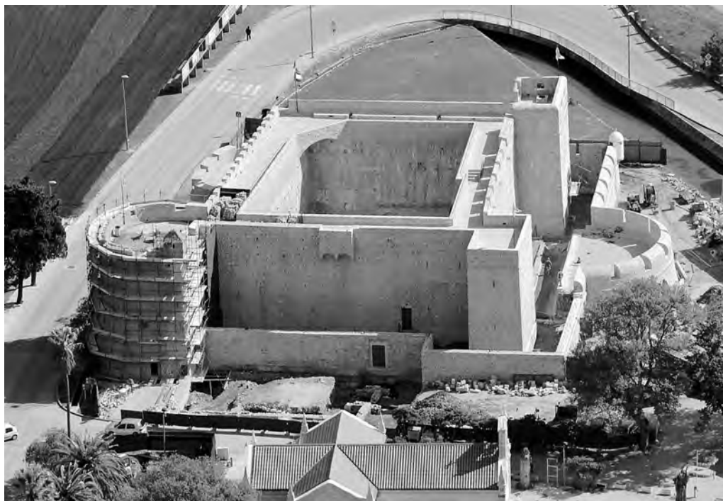
↑ Tvrđava Veliki kaštio tijekom obnove, dokumentacija tvrtke Arheo Plan d.o.o., Foto A. Kovačević

puna četiri stoljeća. Obuhvaćao je zidine Stona i Malog Stona, izdvojeni korpus tvrđave Veliki kaštio te Veliki zid s trima tvrđavama, flankiran s deset okruglih i trideset i jednom četvrtastom kulom te sa šest polukružnih bastiona. Na njegovim su rubnim točkama organizirane dvije urbane jezgre, Ston i Mali Ston, izraziti primjeri