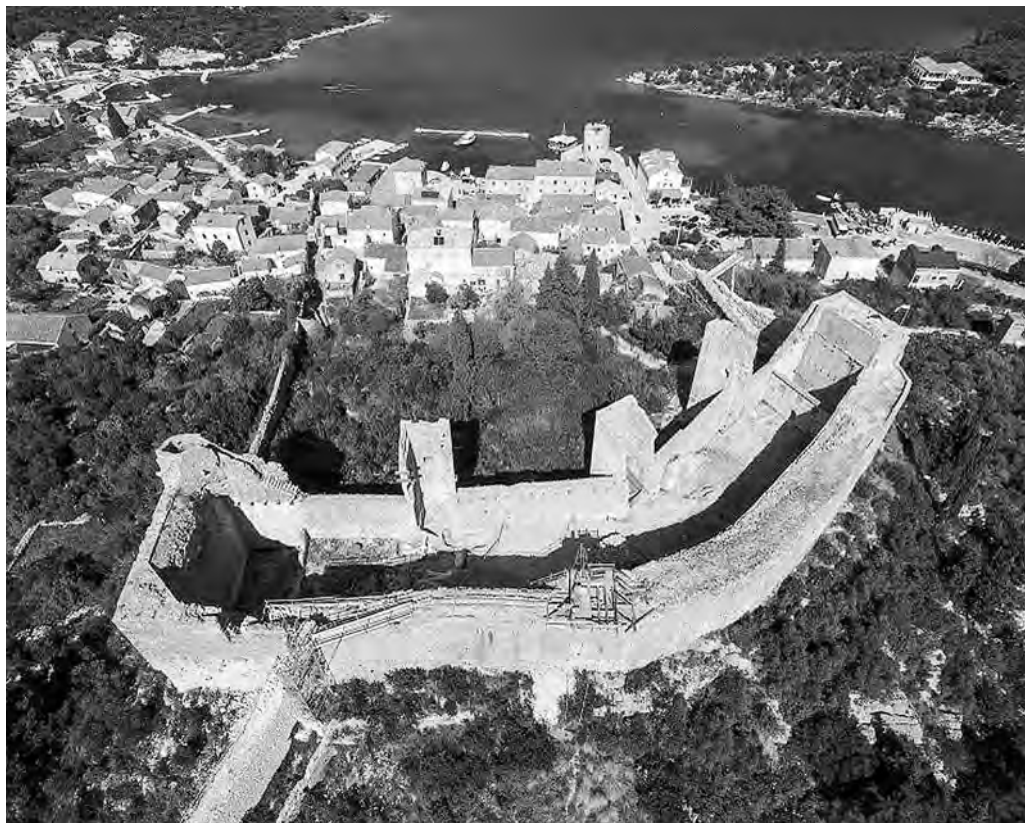
↑ Tvrđava Koruna tijekom obnove, dokumentacija Društva prijatelja dubrovačke starine, foto Lj. Gamulin

godine, a od 14. stoljeća naovamo doživjela je brojne preinake. 15 Današnje doba tvrđava je dočekala u izrazito lošem stanju, a aktivnosti na njezinoj obnovi započete su 2015. godine. 16 Kako bi se utvrdio slijed povijesnog razvoja tvrđave, tijekom 2017. godine poduzeti su arheološki istražni radovi kojima su, u suglasju s podacima iz dokumentarnih izvora, potvrđene četiri razvojne faze. 17 Na temelju rezultata spomenutih istraživanja izrađuje se projekt obnove tvrđave i njene prezentacije.