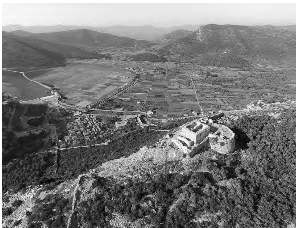
↑ Pogled na tvrđavu Podzvid tijekom arheoloških istraživanja, dokumentacija tvrtke Arheo Plan d.o.o., Foto A. Kovačević

valorizaciju te program revitalizacije. 7 Usljedila je izrada projekta za obnovu tvrđave do koje ipak nije došlo zbog rata. Radovi na obnovi Velikog kaštila započeli su poslije više od dva desetljeća, 2010. godine kada je tvrđava uvrštena u program obnove i uređenja stonskih zidina. 8 Prije početka samog zahvata 2014. godine, građevinski se sklop tvrđave nalazio u izrazito lošem stanju, tako da su prvi opsežni radovi obuhvaćali čišćenje i odvoz otpadnog materijala te uklanjanje raslinja.