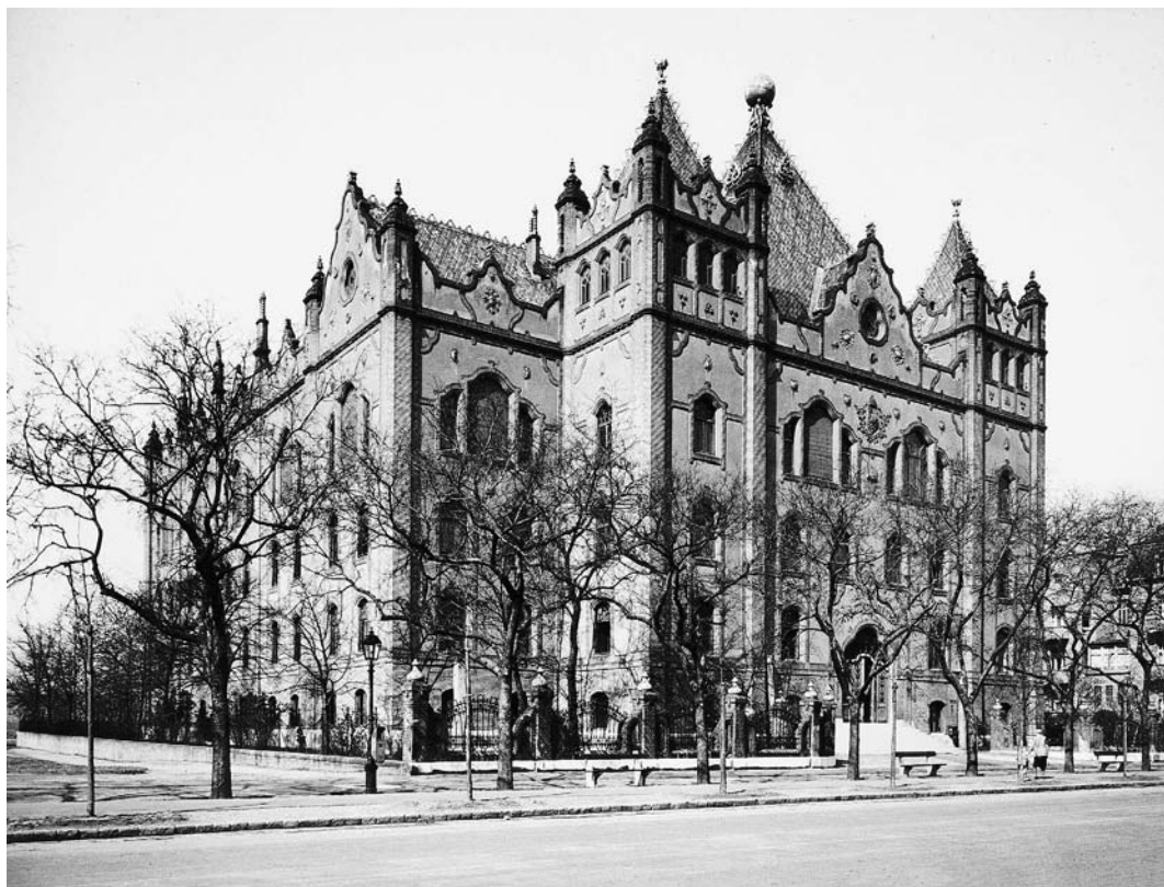
↑ Geološki institut u Budimpešti, izgrađen prema projektu arhitekta Ödöna Lechnera, 1898.–1899.

o vjerskoj toleranciji iz 1781. u ovim je desetljećima polučio i prve protestantske crkve te sinagoge građene od trajnih građevinskih materijala. Kao upravna središta teritorijalnih jedinica grade se gradske vijećnice, od kojih se na našim prostorima tipološki ističe Županijska palača u Osijeku, građena od 1838. do 1842. prema projektu Józsefa Hilda, jednoga od najvećih arhitekata mađarskoga klasicizma. Otvoreni prostori u gode više nisu rezervirani samo za ladanjske sklopove i privatne perivoje, već oni postaju javni i dostupni građanstvu. Pritom se, kao svojevrsna emancipacija od geometriziranih perivoja austrijskoga baroka, ti prostori oblikuju kao pejzažni perivoji po uzoru na engleske, što je rezultat mnogih studijskih putovanja obrazovanijih slojeva, a koji su