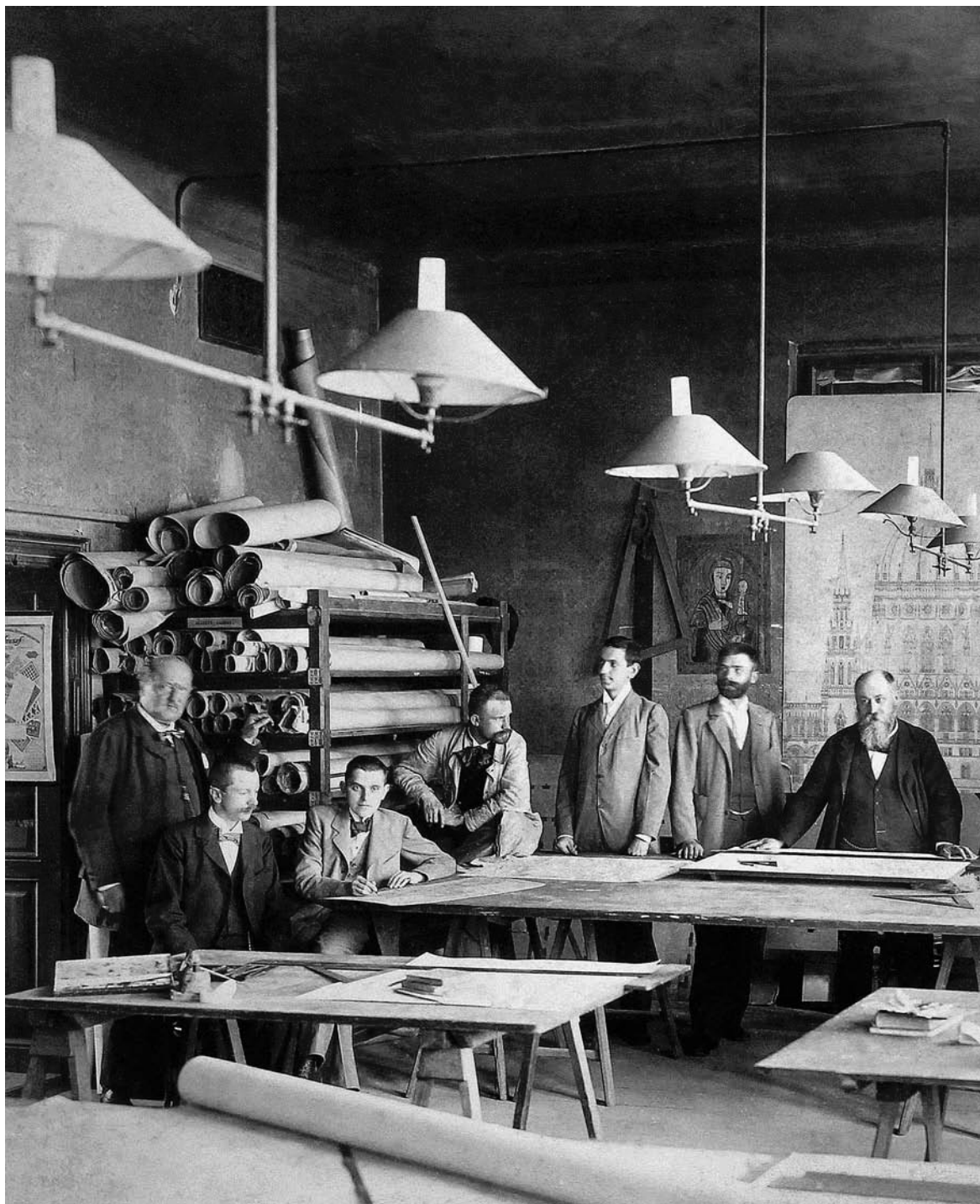
↑ Imre Steindl sa suradnicima tijekom projektiranja i izgradnje Ugarskoga parlamenta, Mađarski muzej arhitekture