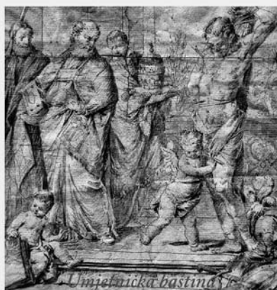
Umjetnička baština ranog novog vijeka u Rijeci, Hrvatskom primorju i Istri NOVA ISTRAŽIVANJA I SPOZNAJE

Program skupa bio je podijeljen u dva dijela. U prvom bloku izlagali su suradnici