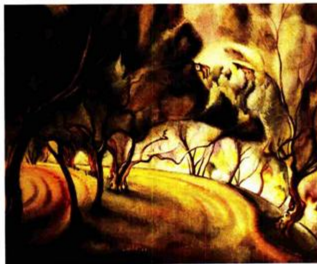
Maslinik , akvarel, 51x63,5 cm

redu i figuraciji u slici vremena nakon I. svjetskog rata, s osobitim utjecajem ekspresionizma i magičnog realizma, zaključuje Dulibić. Tijekom monografskog istraživanja, autor je pronašao fotografije koje je