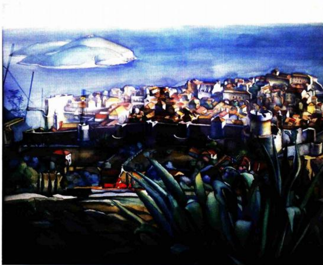
Dubrovnik, 1923. ulje na platnu, 55x68 cm

loga koje dodatno obogaćuju uvid u slikarevo stvaralaštvo, donosi nova saznanja i razbija neke povijesne predrasude vezane za ovog, jednog od najistaknutijih slikara krajolika u hrvat-