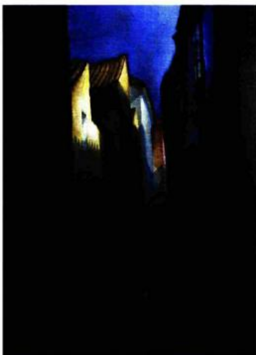
Plava ulica, ulje na platnu, 44x60,3 cm

U ciklusu Studija i monografija koje izdaje Institut za povijest umjetnosti, izašla je 40. po redu knjiga, monografija slikara Vladimira Varlaja. Autor monografije Frano Dulibić knjigu je koncipirao u tri cjeline: Formiranje slikarskog izraza Vladimira Varlaja , Slikarstvo krajolika i Prilozi , među kojima posebno treba naglasiti iscrpnu i nadasve korisnu studiju o slikarevoj recepciji u likovnoj kritici.