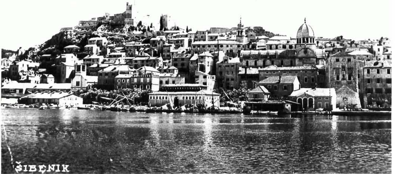
Šibenik, središnji dio obale s početka XX. stoljeća

Šibenik, central part of the waterfront from the beginning of the 20th century