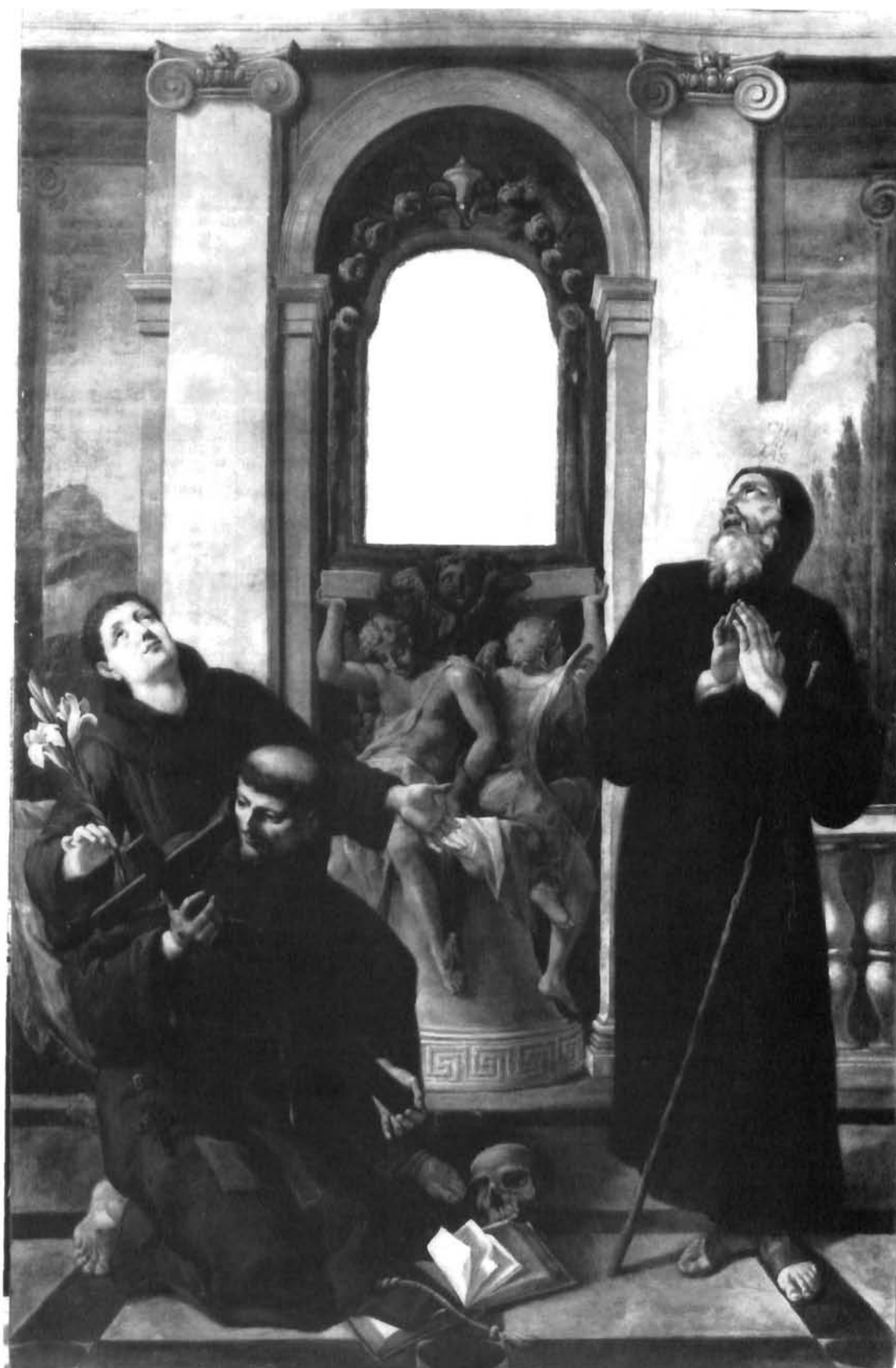
G.B.A. Pitteri, Oltarna pala obitelji Garanjin u katedrali u Trogiru G.B.A. Pitteri, altar pala of the Garanjin family in the Trogir cathedral