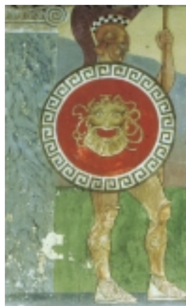
Bogumil Car, freske u Sokolskom domu u Zlataru , 1914., prizori s istočnog zida Bogumil Car, frescoes in the Sokol Palace in Zlatar, 1914, scenes from the east wall