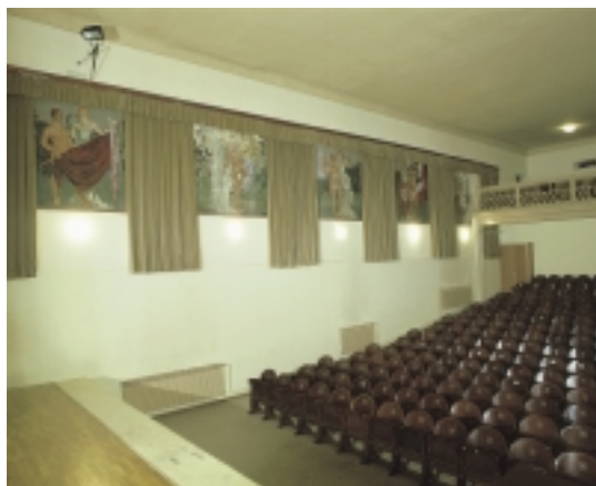
Dvorana u Sokolskom domu u Zlataru (foto: M. Drmić) Auditorium of the Sokol Palace in Zlatar