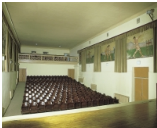
Dvorana u Sokolskom domu u Zlataru Auditorium of the Sokol Palace in Zlatar