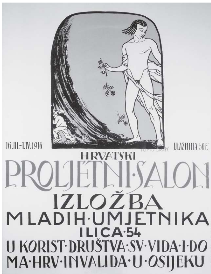
T. Krizman, plakat za izložbu Hrvatskog proljetnog salona , 1916. T. Krizman, Croatian Spring Salon exhibition poster , 1916

postaje sve važnijom društvenom činjenicom. Najčešće su granice toga razdoblja postavljane na 1898. godinu, kao godinu izložbe Hrvatskog salona , te na 1914. godinu, kao »nepobitnu cezuru« zbog početka Prvoga svjetskog rata. 3 Ovim se vremenskim rasponom – uz opasku da bi, zbog kontinuiranog djelovanja umjetnika koji osnivaju Proljetni salon , kraj toga razdoblja, kao i početak novoga, trebalo označiti godinom 1916. – obuhvaćaju i one umjetničke težnje i stavovi koji će značiti prethodnicu na koju se najvećim dijelom oslanja i umjetnost razdoblja Proljetnog salona .