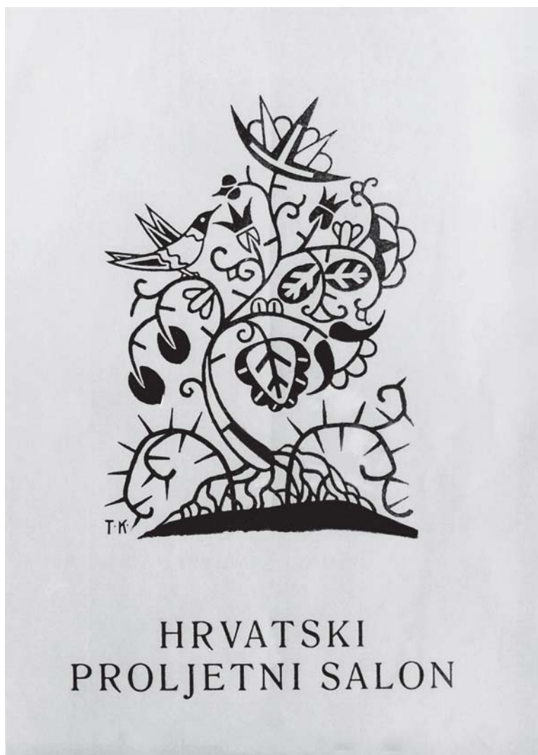
T. Krizman, naslovnica kataloga izložbe Hrvatskog proljetnog salona , 1916.

T. Krizman, front cover of the Croatian Spring Salon catalogue, 1916