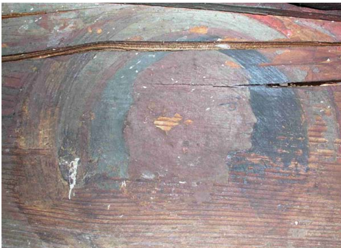
2. Medaljon u kapitularnoj dvorani Samostana sv. Križa na Čiovu The medallion in the chapter hall of the monastery of Holy Cross, Čiovo