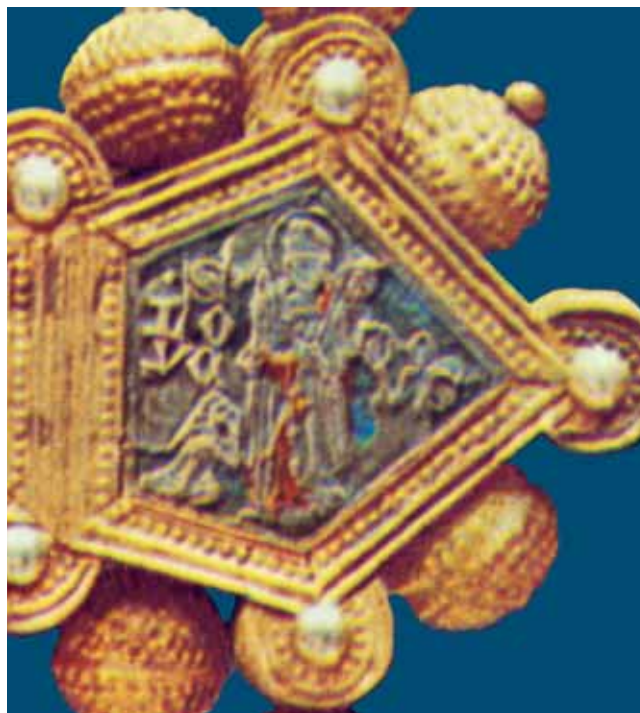
3. Desni krak aversa ophodnog križa (reprodukcija prema fotografiji T. Dapca u knjizi I. Petriciolija Zadarsko zlatarstvo , Beograd, 1971.) Right arm of the obverse of the processional cross

3a. Sv. Ludovik Tuluški i donatorica, desni krak aversa ophodnog križa (reprodukcija prema fotografiji T. Dapca u knjizi I. Petriciolija Zadarsko zlatarstvo , Beograd, 1971.)