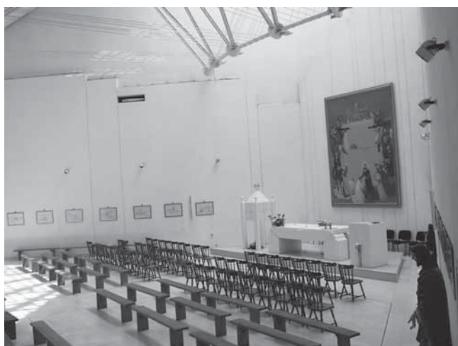
6. Tuzla, Crkva sv. Petra i Pavla, arhitekt Zlatko Ugljen. Tuzla, Church of St Peter and Paul by architect Zlatko Ugljen

o njemu bi se imalo što govoriti u smislu pamćenja iskustva grada. No ovaj put Ugljenova arhitektura značajna je jer na specifičan način naglašava jednu od tema crkvene arhitekture, temu zajedništva. Zlatko Ugljen ostvaruje prostor konvergencije najjednostavnijim sredstvima i čistom svjetlošću i bjelinom, a zatim taj smjer zajednice prema oltaru, mjestu svete obredne radnje, mjestu pretvorbe i usmjerenja uvis, na zidu svetišta preusmjerava okomicom koja se u obliku ljestava (drevna biblijska metafora) uspinje prema nebu. Jasnoća znaka, sažetost, organska utemeljenost dekoracije i narativnih elemenata, sabranost atmosfere – uvijek su biljeg značajnih stvaralaca i znak razumijevanja baštinenog.