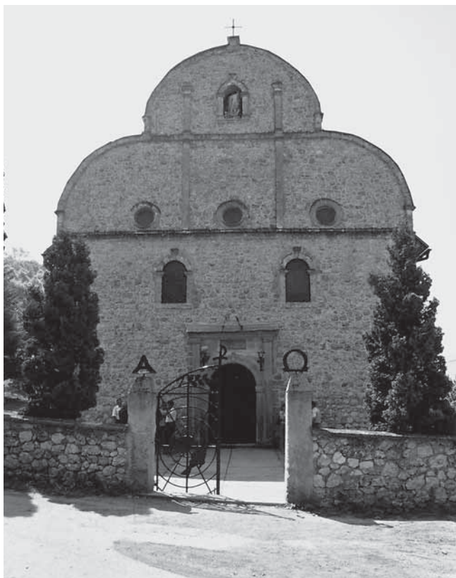
2. Ovčarevo, Crkva sv. Mihovila, arhitekt nepoznat. Ovčarevo, St Michael's church, anonymous architect