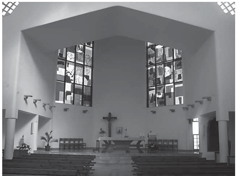
4. Kiseljak, Crkva sv. Ilije, arhitekt Antun Karavanić. Kiseljak, St Elias' church by architect Antun Karavanić

prostranim krajolikom. Arhitekt Antun Karavanić očito je od povijesnih pouka uočio jedino da se sakralno zdanje po nečem izdvaja od svoje okoline. Kako bi dakle bila što sakralnija, čime bi se što više izdvajala, on je svoju crkvu uresio nizom neobrazloživih i ničim motiviranih oblika, od kojih se gotovo svi međusobno poništavaju. Tako sječeni uglovi dobivaju preda se još oštre bridove, ondje gdje bi se očekivao rast u nebo lukovi se savijaju i vraćaju prema zemlji, izabrani materijali kolebaju se između hotela i javnih kupališta, agresivna drvena skulptura, poput učila, na ulazu, bori se s nasrtljivošću staklenih prizmi; ali tek unutrašnjost pokazuje svu obesmišljenost ove arhitekture. Ona bi također optirala za bazilikalnu longitudinalu, samo što je demantira svim mogućim asimetrijama. U prvom redu asimetrijom kora, neuravnoteženošću svjetlosti (koja nimalo ne računa na obvezu prema svetome mjestu), a zatim i neodlučnošću u svetištu. U posljednje vrijeme promašenost crkve (o nizu dekorativnih detalja primijenjenih umjetnosti nismo govorili)