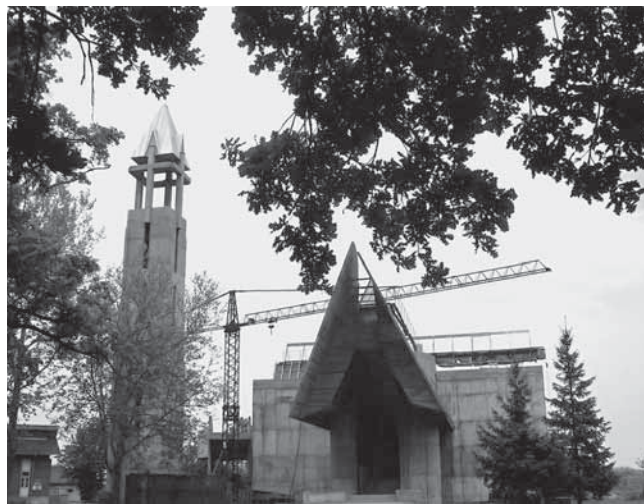
5. Dubrave, Crkva Bezgrješnog začeća Marijina, arhitekt Ivan Štraus. Dubrave, Church of the Immaculate Conception by architect Ivan Štraus

5. U sklopu Samostana svetog Ante u Dubravama kod Brčkog, na mjestu Crkve Bezgrješnog začeća Marijina porušene u posljednjem ratu, gradi se, opet uz presudni udio fra Stjepana Pavića, nova crkva po projektu sarajevskog arhitekta Ivana Štrausa. 4 Vrlo zanimljiv projekt, koji tradicijske teme zapadnokršćanskih bogomolja tretira na vrlo osoban i smion način. Tu je prije svega povezanost ulaznog hodnika i monumentalne dvoranske crkve, staklena vertikala ulaza koja usmjeruje prema staklenom križu na svodu građevine – staklenom bridu krovništva uzdužne i poprečne lađe. Tako dvorana biva rasvijetljena »ravno s nebesa«, a križ se ukazuje u najrazličitijim svjetlostima doba dana i doba godine, pa i kao kadrirana slika zvjezdanoga neba. Ništa se u ovoj crkvi ne bi moglo smatrati referencom na ma kakvo naslijeđe. Pa ipak, njezin najjači motiv, sjecište greda i šupljina u križiš-