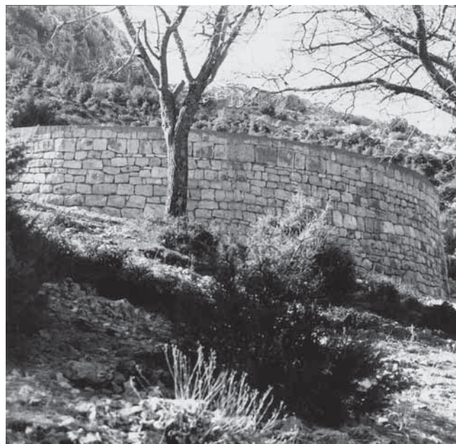
1. Gradac, svetište na otvorenom, arhitekt Ivan Prtenjak. Gradac, open-air sanctuary by architect Ivan Prtenjak

2. U Ovčarevu, na padinama Vlašića, tri kilometra od Travnika, nalazi se veoma neobična crkva – i ne samo za Bosnu i Hercegovinu. 2 Posvećena svetom Mihovilu, izgrađena je u kompozitnom, gotičko-renesansnom stilu, kakav je obilježio zlatno doba Dubrovnika. Ali ona nije nastala u petnaestom ili šesnaestom stoljeću, nego 1869. godine. Problem bi mogao biti riješen uključivanjem crkve u kontekst historicizma. Za taj je pak kontekst crkva odviše nedogmatska i odviše rana. Tražeći njezina autora, kojega nisam našla, crkvom sam se