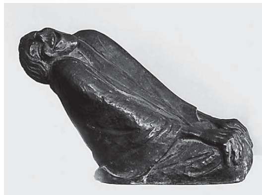
Ernst Barlach, Starac koji se smije , 1937., bronca, Ernst Barlach Foundation, Güstrow

fin de siècle koja prožima aktove secesije i art-nouveaux . Kao da je Meštrović, bečki đak pripušten među velikane secesijskoga kruga u metropoli, tražio neku vrstu otklona od suptiliteta tamošnjega neoklasičnoga i secesijskoga kiparskog načina, jednako kao i od klimtovskog mozaičnog dekorativizma i beskrajnog vijuganja linija. Našao ga je u nekoj vrsti rustičnosti i paroksizma forme, koju je kao poputbinu ponio iz pasivnih krajeva svoga zavičaja. Ako je i asimilirao antičku, egipatsku, perzijsku, asirsku umjetnost u vremenu traženja vlastitog izraza, ako je stilizirao i dekorirao načinom secesije, Meštrović je ipak krenuo prema nekoj vrsti od stilova apstinirajuće tjelesnosti, prema onome što A. G. Matoš prepoznaje kao »atavizam pradavnog heroizma (...) ideal heroizma za naše bezenergijske dane (...) mramorni paroksizam izljeva genijalne, ali tragične i sasvim neoplemenjene, divlje duše, anarhijske, haotične i prkosne«. 10 Naime, unatoč brojnim podsjećanjima, sad na antiku, sad na Rodina, sad na