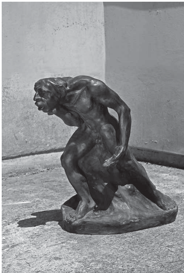
Juraj Škarpa, Srdžba , 1921., sadra, vl. obitelj Škarpa, Zagreb

Juraj Škarpa, Anger, 1921, gypsum, property of the Škarpa family, Zagreb