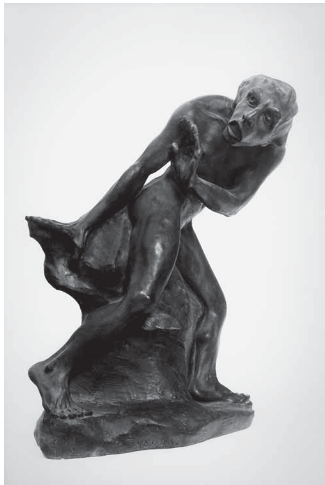
Juraj Škarpa, Strah , 1921., sadra, vl. obitelj Škarpa, Zagreb

Juraj Škarpa, Anger, 1921, gypsum, property of the Škarpa family, Zagreb