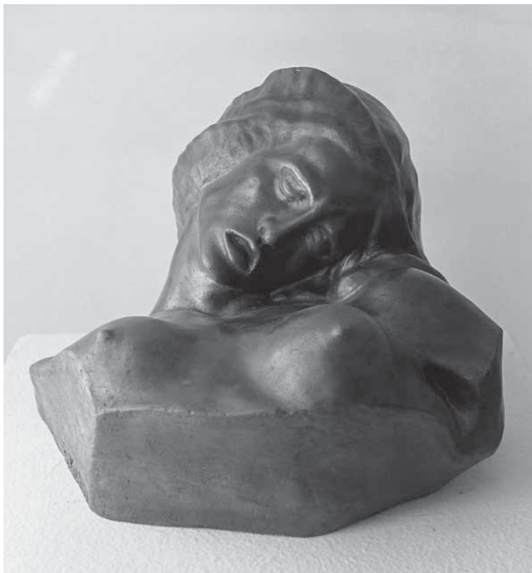
Juraj Škarpa, Bol , 1921., mramor, vl. obitelj Škarpa, (foto: B. Cvjetanović) Juraj Škarpa, Pain , 1921, marble, property of the Škarpa family