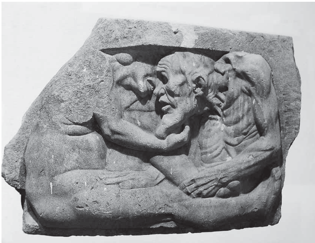
Ivan Meštrović, Starac i djevojka , 1906./07., kamen, Galerija Ivana Meštrovića, Split Ivan Meštrović, Old Man and a Girl , 1906/07, stone, Ivan Meštrović Gallery, Split

oslabljene i utišane varijante europskih avangardnih tendencija, jedna vrsta srednje struje na tradicijsko-avangardnom razmeđu. Ili slikovito rečeno: naš kubizam prije je Lhoteova nego Braqueova tipa, baš kao što su nam bliži Kraljević i Cezanne od Picassova radikalizma.