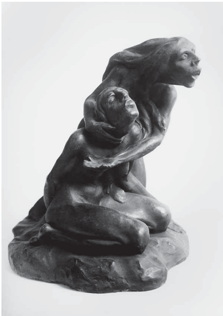
Juraj Škarpa, Nesvjest i histerija (detalj), 1921., sadra, vl. obitelj Škarpa, Zagreb

Juraj Škarpa, Unconsciousness and Hysteria (detail), 1921, gypsum, property of the Škarpa family, Zagreb