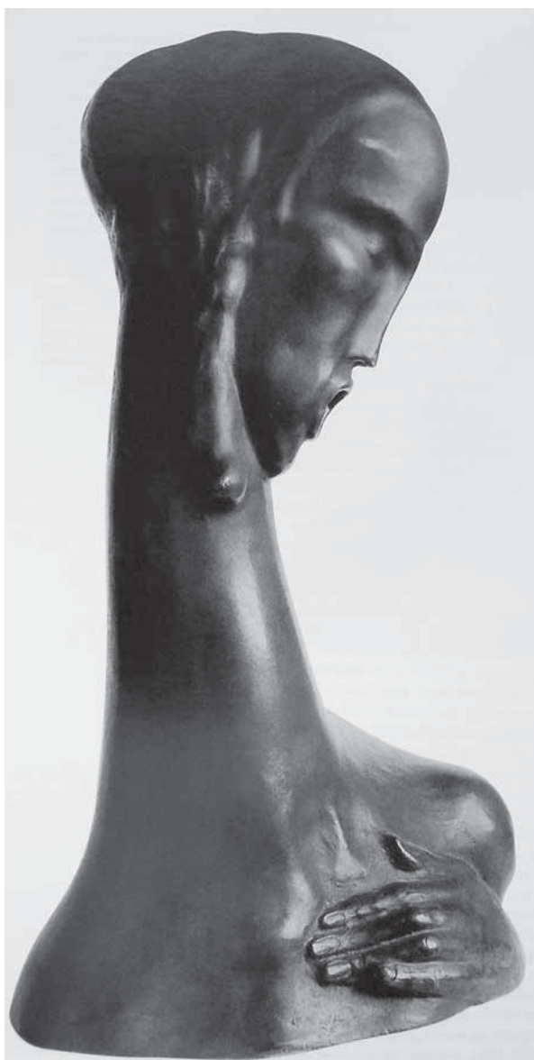
Juraj Škapa, Bez naslova , 1921., pečena zemlja, vl. obitelji Škarpa, Zagreb