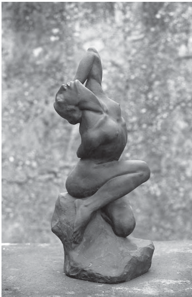
Juraj Škarpa, Ranjenica , 1921., bronca, vl. Galerija Juraj Plančić, Stari Grad

Juraj Škarpa, Wounded Woman, 1921, bronze, property of Juraj Plančić Gallery, Stari Grad