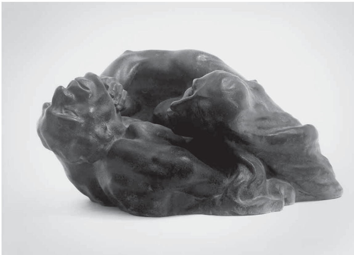
Juraj Škarpa, Nasilje , 1921., sadra, vl. obitelj Škarpa, (foto: M. Koman)

Juraj Škarpa, Violence, 1921, gypsum, property of the Škarpa family