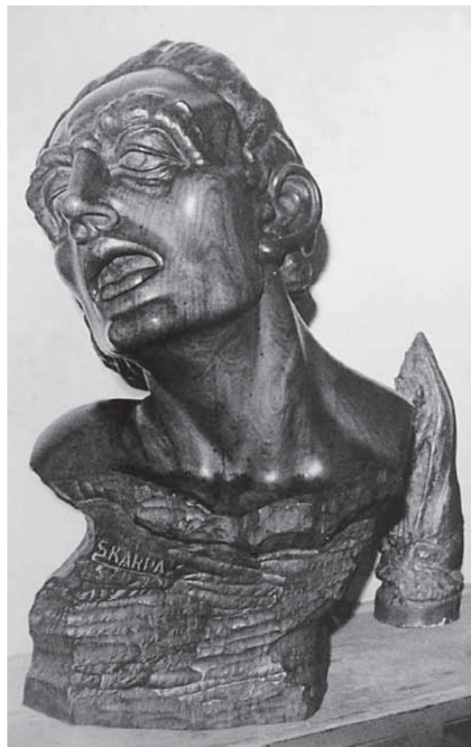
Juraj Škarpa, Bol , 1940., drvo, vl. obitelj Škarpa, Zagreb Juraj Škarpa, Pain , 1940, wood, property of the Škarpa family, Zagreb