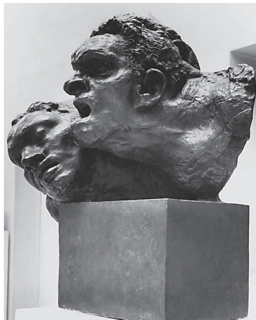
Antoine Bourdelle, Urlajuća lica , 1894./99., bronca, Muzej Bourdelle, Pariz

Ernst Barlach, Old Man Laughing, 1937, bronze, Ernst Barlach Foundation, Güstrow