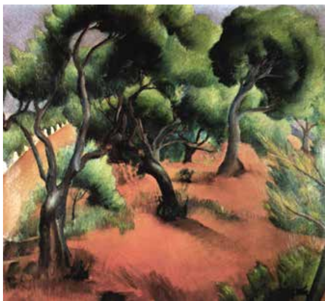
Jerolim Miše, Borovi u Supetru (Dalmatinski pejzaž) , 1928., Zbirka Flögel, Beograd Jerolim Miše, Pine Trees in Supetar (Dalmatian Landscape) , 1928, Flögel Collection, Belgrade

Sodomu i Gomoru: »Berlin koji sve prodaje, koji bjesomučno egoistički špekulira, koji se utapa u bludu i luksuzu (...) Boga mi užasni su mi ovi velegradovi. Sada dobro razumijem onu perverznost raznih likovnih i književnih struja. Pa da, oni