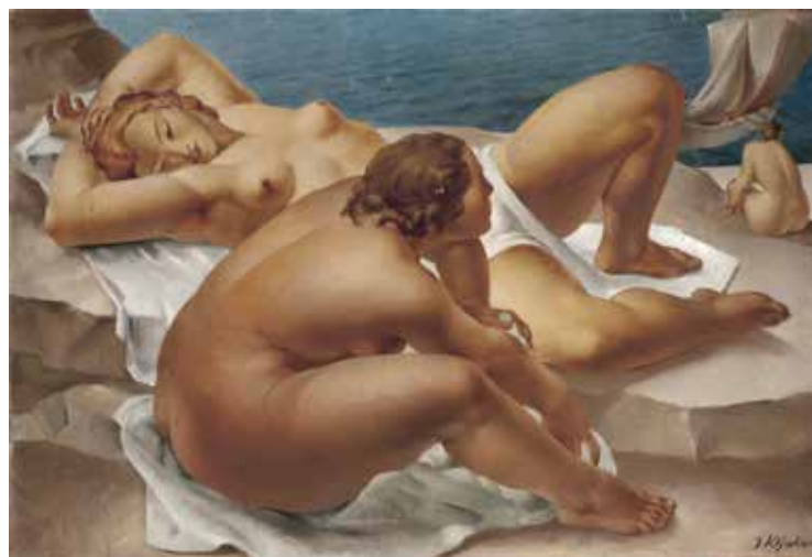
Jozo Kljaković, Dva akta (Ljeto) , oko 1935., privatno vlasništvo Jozo Kljaković, Two Nudes (Summer) , ca. 1935, private collection