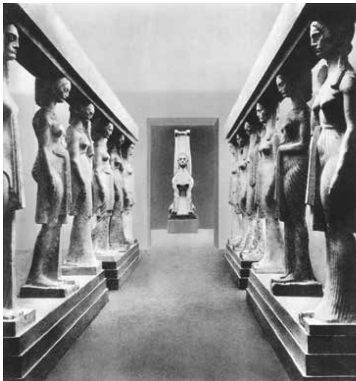
Ivan Meštrović, S izložbe Secesije u Beču, 1909. Ivan Meštrović, From the Secession Exhibition in Vienna, 1909