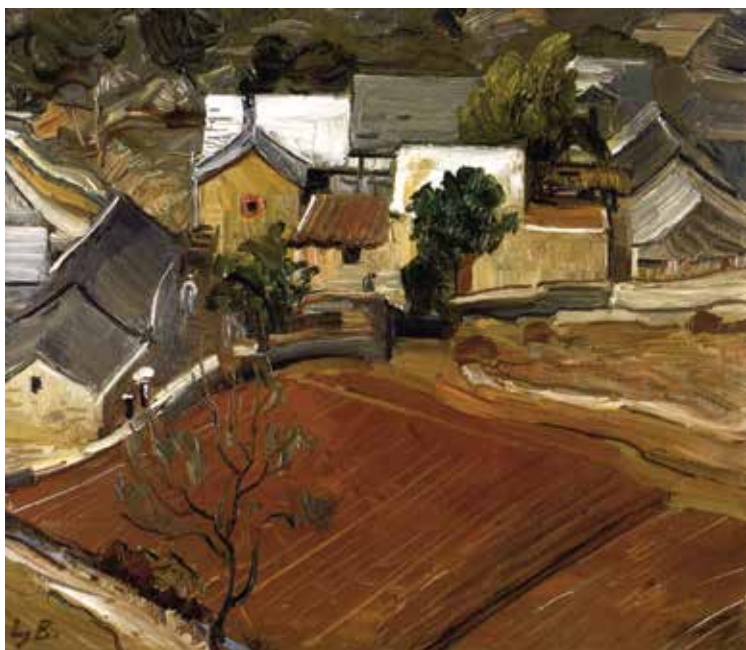
Ljubo Babić, Zagorski pejzaž (Novembar) , 1937., Moderna galerija, Zagreb Ljubo Babić, Zagorje Landscape (November), 1937, Modern Gallery Zagreb

utvrditi, da je taj naš osebuji izraz pri svom svršetku (...). Imajući u vidu te dvije suprotnosti, ta dva likovna svijeta, jedan potpuno primitivan i rustički, a drugi u svojim početnim fazama već urbanistički, razumjet ćemo i duboki jaz, koji ih dijeli. Jedan skroz na skroz vezan o potrebe i o tlo, izrastao iz rase, a drugi, da tako kažem, u zraku, nepovezan o svoju sredinu, u mnogo slučajeva i protivnik te sredine. Taj je drugi izraz pod stranim utjecajem izrastao zbunjen, ekonomski neuslovljen. 38