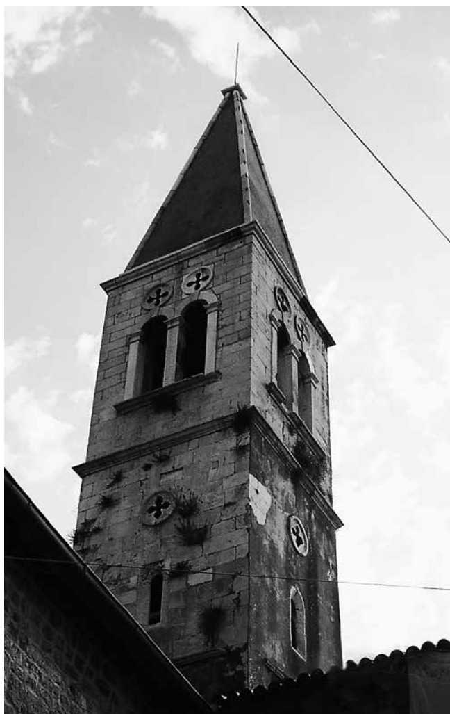
Zvonik crkve sv. Petra Belfry of St Peter's church