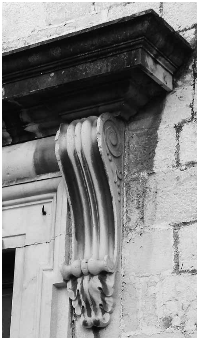
Konzola uz portal župne crkve u Kaštel Štafiliću Console at the portal, parish church in Kaštel Štafilić