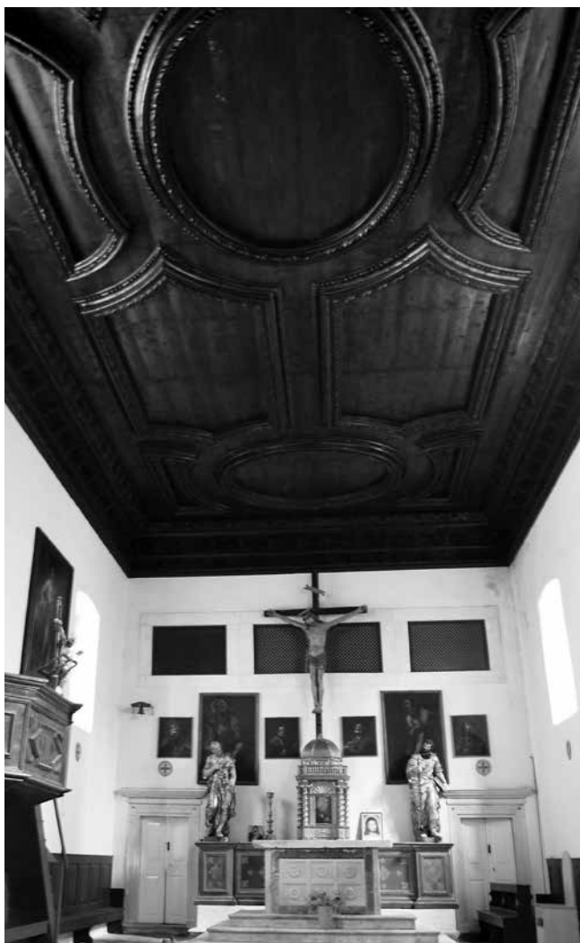
Unutrašnjost crkve sv. Petra, istočna strana Interior of St Peter's church, eastern side