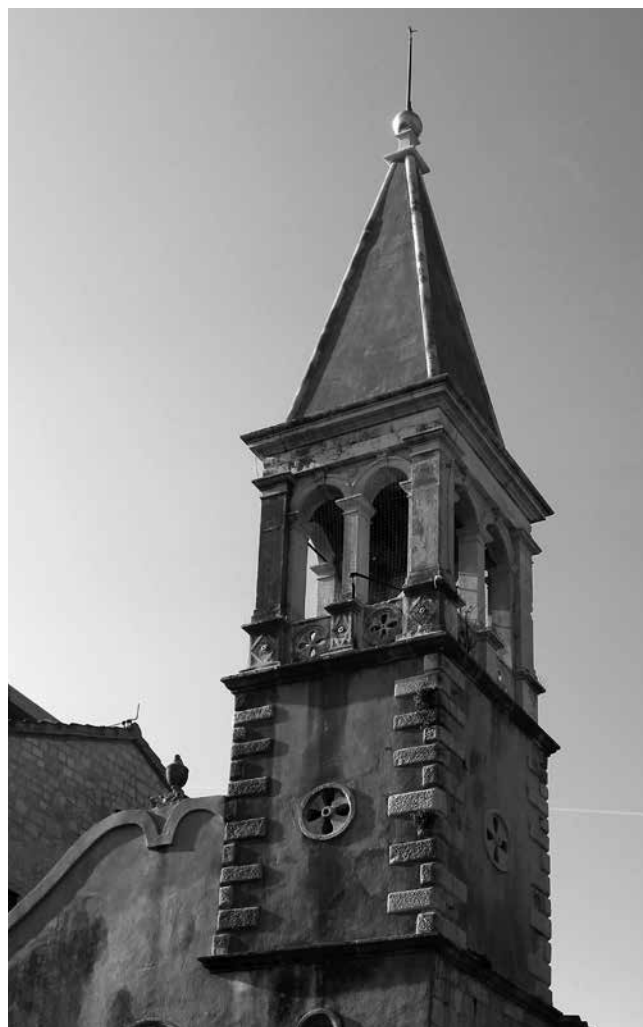
Zvonik crkve Gospe od Karmela u Trogiru Belfry of the church of Our Lady of Carmel in Trogir

Često ponavljanje ovog motiva na portalima crkava koje je gradio Ignacije Macanović Ivanov može se tumačiti činjenicom da su on i njegov otac Ivan posjedovali prijevod Vitruvijeva traktata o arhitekturi, mletačko izdanje iz 1567. godine, praćeno Palladijevim ilustracijama. 32 U tom izdanju na tabli na strani 189, na kojoj su ilustracije vrata hrama, prikazan je crtež konzola i to enface i bočno. U tumačenju, u legendi na strani 188 zapisano je: f. ancones, cartelle; c. foglio . Na crkvama koje je gradio Ignacije Macanović, uz portale pod konzolama vješto su isklesani svežnjevi lišća, koji se u mletačkom izdanju Vitruvija nazivaju foglio . Gotovo su identične prozorske ruže na crkvi sv. Petra i na onoj župnoj u Kaštel Štafiliću; obje rozete su stupnjevito umetnute u zid pročelja. Slični su im kapiteli na žbicama, a središnji, mali krug ima jednake perforacije u obliku četverolista.