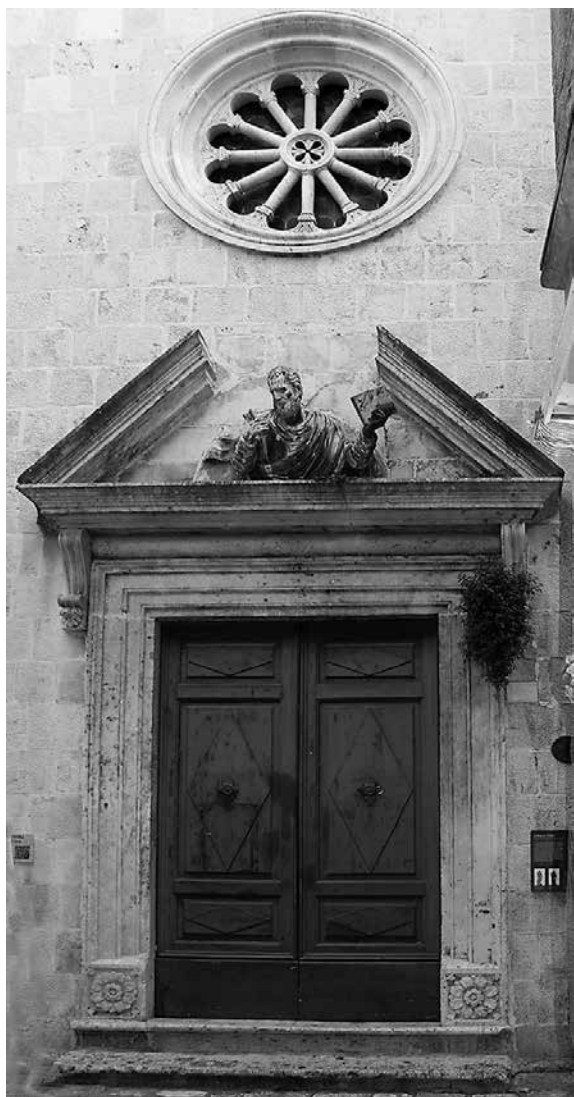
Dio pročelja crkve sv. Petra u Trogiru Segment of the front façade, St Peter's church in Trogir