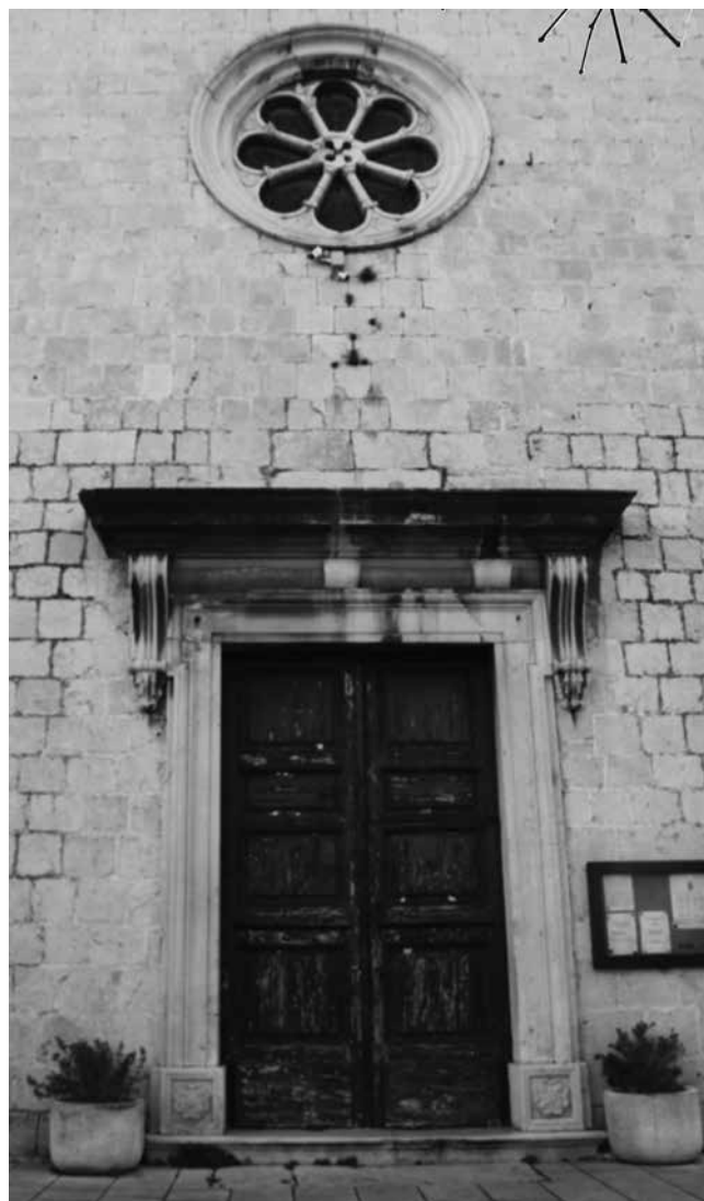
Dio pročelja župne crkve u Kaštel Štafiliću Segment of the front façade, parish church in Kaštel Štafilić

nog lišćem i figurama anđela. Dva bočna, reprezentativna, mramorna oltara nalaze se sučelice, jedan na sjevernom zidu, drugi na južnom. Strop crkve, izrađen u drvu, također je bogato izrezbaren na način uobičajen u baroknim mletačkim crkvama i palačama. Na bočnom, sjevernom zidu su polukružni otvor (termalni tip prozora) i dva velika pravokutna prozora, na kojima je izvorna željezna rešetka. Istih su oblika i formata prozori na južnome, bočnom zidu (samo jedan pravokutni i jedan polukružni). Na zapadnom zidu je svjetlo ulazilo kroz veliku prozorsku ružu, koju je naknadno zaklonilo kućište orgulja.