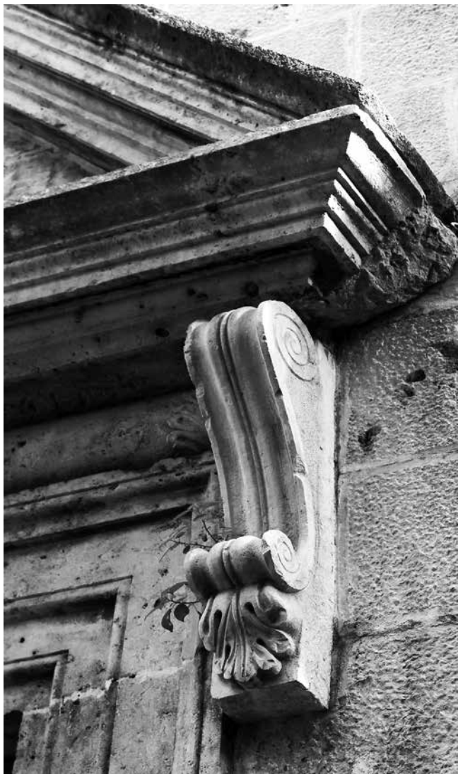
Konzola uz portal crkve sv. Petra u Trogiru Console at the portal, St Peter's church in Trogir