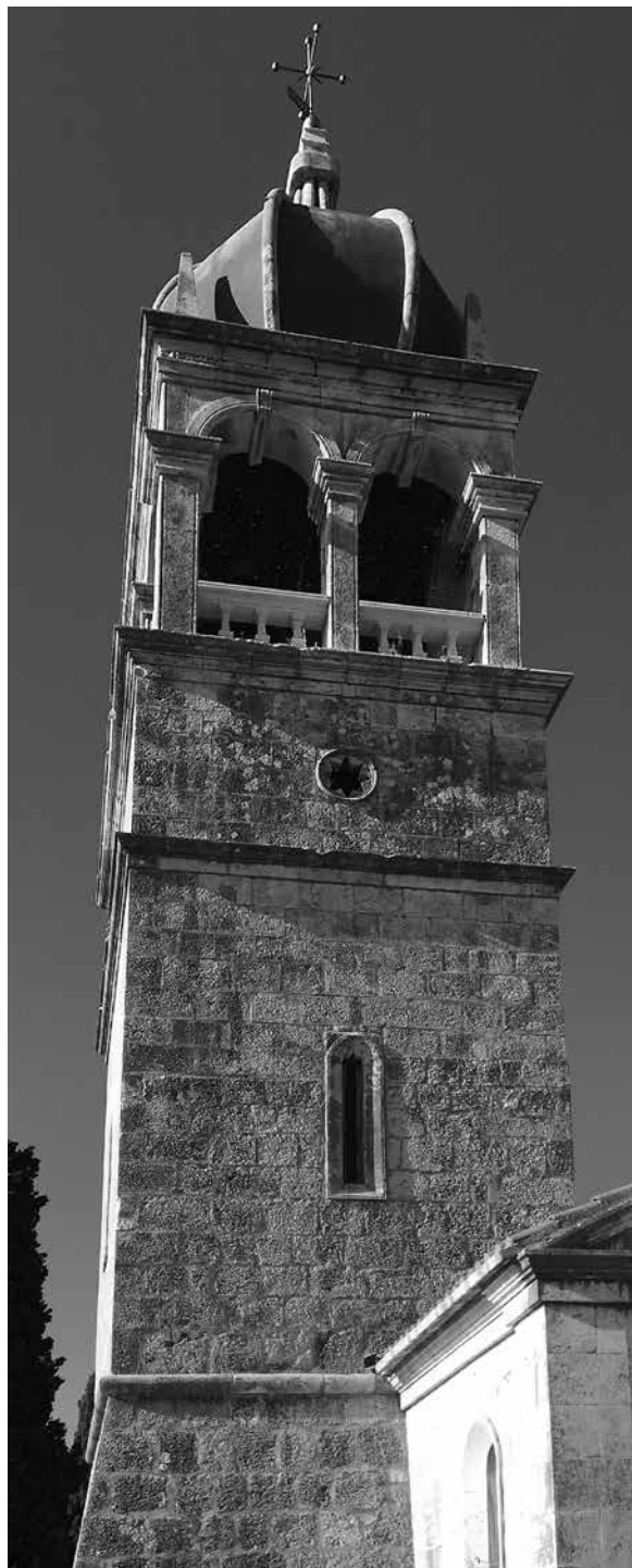
Zvonik župne crkve u Donjem Humcu na Braču Belfry of the parish church in Donji Humac on the island of Brač

Samostanska crkva u Trogiru i ona župna u Kaštel Štafiliću imaju na bočnim zidovima velike, polukružne (termalne) prozore kakve su često zidali Ignacije Macanović i radionica, primjerice na župnoj crkvi u Nerežišćima. 36