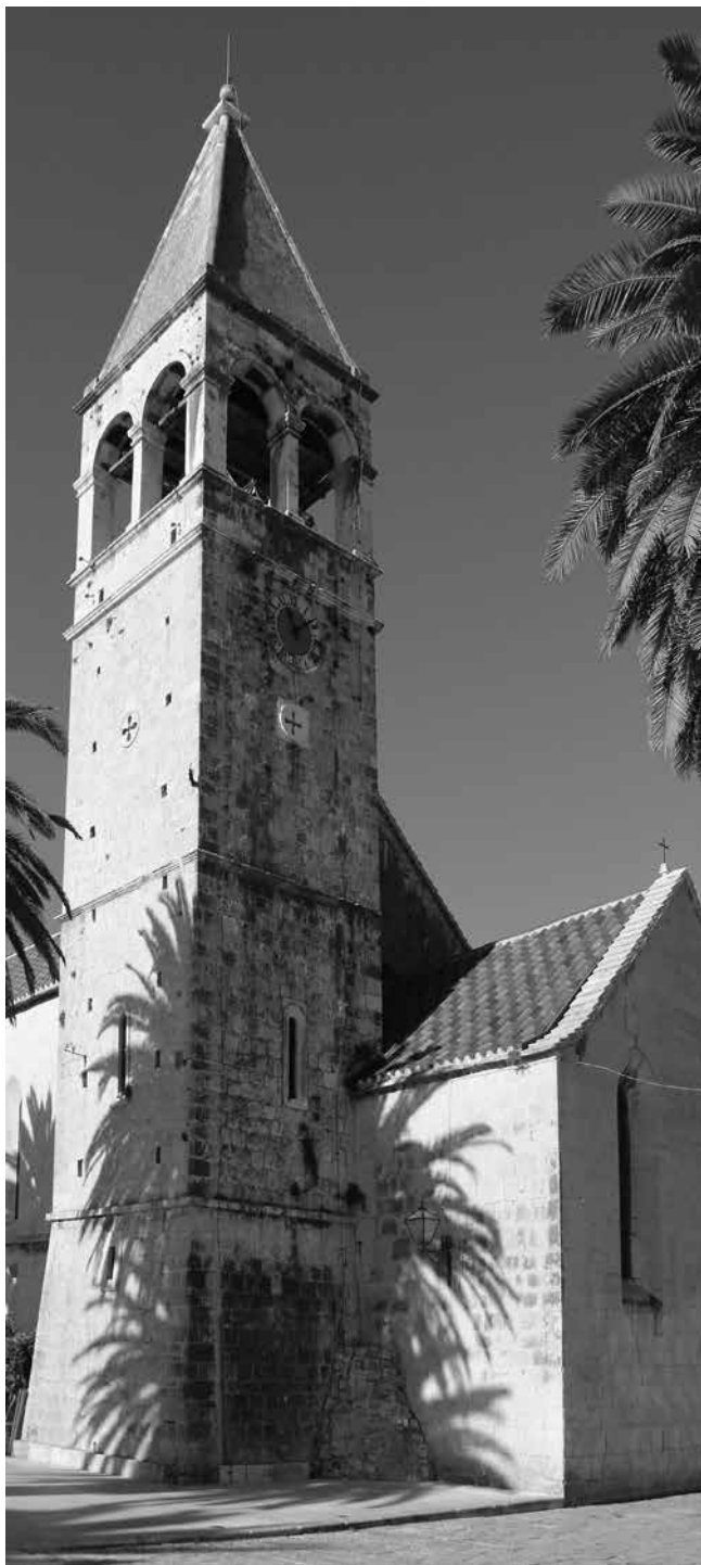
Zvonik samostanske crkve sv. Dominika u Trogiru Belfry of the conventual church of St. Dominic in Trogir