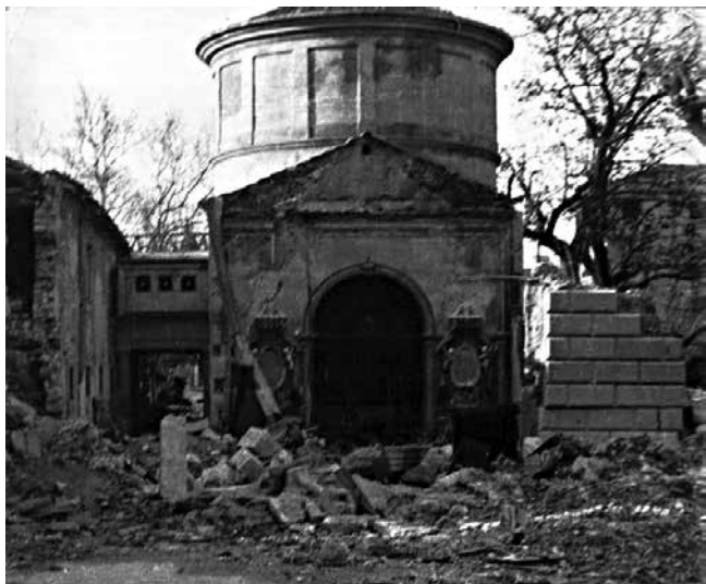
2. Crkva Gospe od Zdravlja i susjedni kapucinski samostan nakon bombardiranja u Drugome svjetskom ratu Church of Our Lady of Health and the neighbouring Capuchin monastery after a bombardment during World War II

noj redovničkoj ćeliji), a navedeni su i dijelovi kamene opreme, na primjer umivaonik u andiettu ili una scaffa di pietra u kuhinji. Za struku je zasigurno najzanimljiviji opis kapele na prvome katu u kojoj su se nalazila dva drvena klecala te prije spomenuti mramorni oltar s menzom di Pietra viva, e pietra Sacra nel mezzo i oltarnom palom s prikazom Bogorodice Bezgrješne. Nažalost podatci o autoru, vremenu nastanka ili naručitelju oltara i pale nisu navedeni. Zanimljiv je i podatak