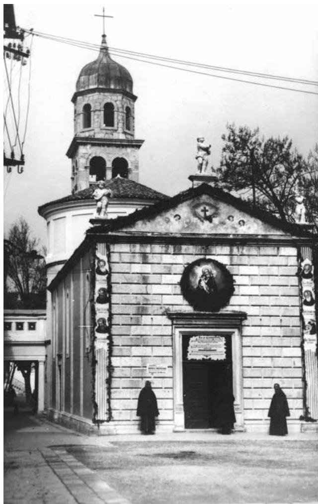
1. Crkva Gospe od Zdravlja u Zadru s dva kapucinska redovnika, 1926.

Kapucinski hospicij podignut je južno od crkve Gospe od Zdravlja. Nažalost, zgrada hospicija, kao i sama crkva Gospe od Zdravlja, teško su stradali tijekom bombardiranja u Drugome svjetskom ratu (1939.–1945.), kao što se može vidjeti na crno-bijeloj fotografskoj snimci pročelja crkve s očuvanom rotandom svetišta u pozadini i djelomično razrušenim zidom hospicija s lijeve strane (sl. 2.). 35 Fotografija nam također otkriva da je hospicij s crkvom bio povezan nadzemnim hodnikom koji je premošćivao ulicu koja ih je dijelila. Nakon bombardiranja sačuvao se i trijem koji je