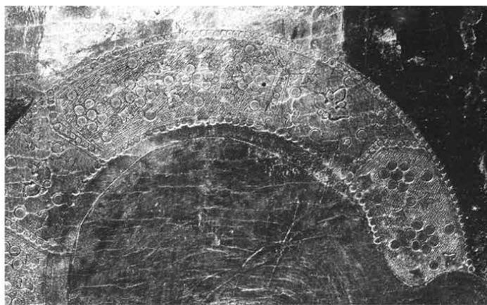
8. Blaž Jurjev, puncirani ukras aureole sv. Nikole, detalj šibenskog poliptiha (privatna zbirka) / Menegelo Ivanov de Canali, puncirani ukras aureole raspelog Krista, detalj raspela (nekad u crkvi sv. Marije u Zadru)

Biagio di Giorgio da Traù, punched decoration on the halo of St Nicholas, detail of the Šibenik polyptych (private collection) / Menegelo Ivanov de Canali, punched decoration on the halo of the crucified Christ, detail of the crucifix (formerly in St Mary's church in Zadar)