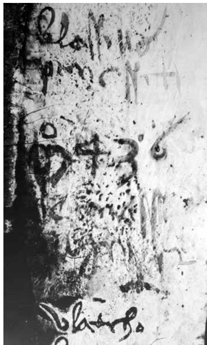
5. Blaž Jurjev, zabilješka na poliptihu iz crkve sv. Jakova na Čiovu (Trogir, Muzej sakralne umjetnosti)

Blažev lik sv. Mihovila na šibenskom poliptihu 47 tipološki je izrazito srodan Menegelovu liku sv. Jurja na Triptihu Varoške Gospe , a određene podudarnosti pokazuju i Blaževi prikazi sv. Mihovila na poliptihu iz crkve sv. Ivana u Trogiru i na poliptihu iz Opatske riznice u Korčuli. Lik sv. Ivana Krstitelja na poliptihu iz Opatske riznice u Korčuli doslovno izgleda poput izvedenice neke od Menegelovih varijanti prikaza tog sveca (najbliže onom iz Kožlovca – nekad u manastiru Krka). Također je i lik sv. Ivana Krstitelja na poliptihu iz crkve sv. Ivana u Trogiru blizak Menegelovim prikazima tog sveca, čak i fizionomijom sličan onima iz Kožlovca i Ferma. Blažev lik sv. Kristofora na poliptihu iz crkve sv. Jakova na Čiovu tek je dijelom usporediv s Menegelovim prikazom istog sveca