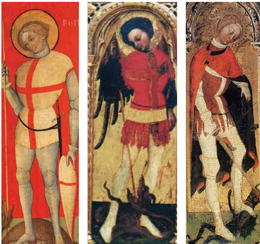
1. Menegelo Ivanov de Canali, Sv. Juraj, detalj "Triptiha Varoške Gospe" (Zadar, Stalna izložba crkvene umjetnosti) / Blaž Jurjev, Sv. Mihovil, detalj poliptiha (Šibenik, Interpretacijski centar katedrale sv. Jakova "Civitas sacra") / Blaž Jurjev, Sv. Mihovil, detalj poliptiha (Trogir, Muzej sakralne umjetnosti)

Menegelo Ivanov de Canali, St George, detail of the "Triptych of Our Lady of Varoš" (Zadar, Permanent Exhibition of Sacral Art) / Biagio di Giorgio da Traù, St Michael, detail of the polyptych (Šibenik, Interpretation Centre of St James' Cathedral "Civitas sacra") / Biagio di Giorgio da Traù, St Michael, detail of the polyptych (Trogir, Museum of Sacral Art)