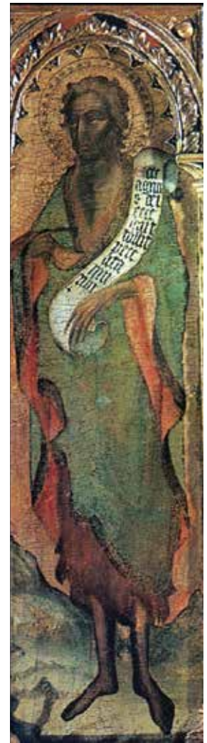
2. Menegelo Ivanov de Canali, Sv. Ivan Krstitelj (Kraj na Pašmanu, samostan sv. Duje) / Menegelo Ivanov de Canali, Sv. Ivan Krstitelj (nekad u manastiru Krka) / Blaž Jurjev, Sv. Ivan Krstitelj, detalj poliptiha (Korčula, Opatska riznica Sv. Marka) / Blaž Jurjev, Sv. Ivan Krstitelj, detalj poliptiha (Trogir, Muzej sakralne umjetnosti)

Menegelo Ivanov de Canali, St John the Baptist (Kraj on the island of Pašman, monastery of St Doimus) / Menegelo Ivanov de Canali, St John the Baptist (formerly in the monastery of Krka) / Biagio di Giorgio da Traù, St John the Baptist, detail of the polyptych (Korčula, Abbot's Treasury of St Mark) / Biagio di Giorgio da Traù, St John the Baptist, detail of the polyptych (Trogir, Museum of Sacral Art)