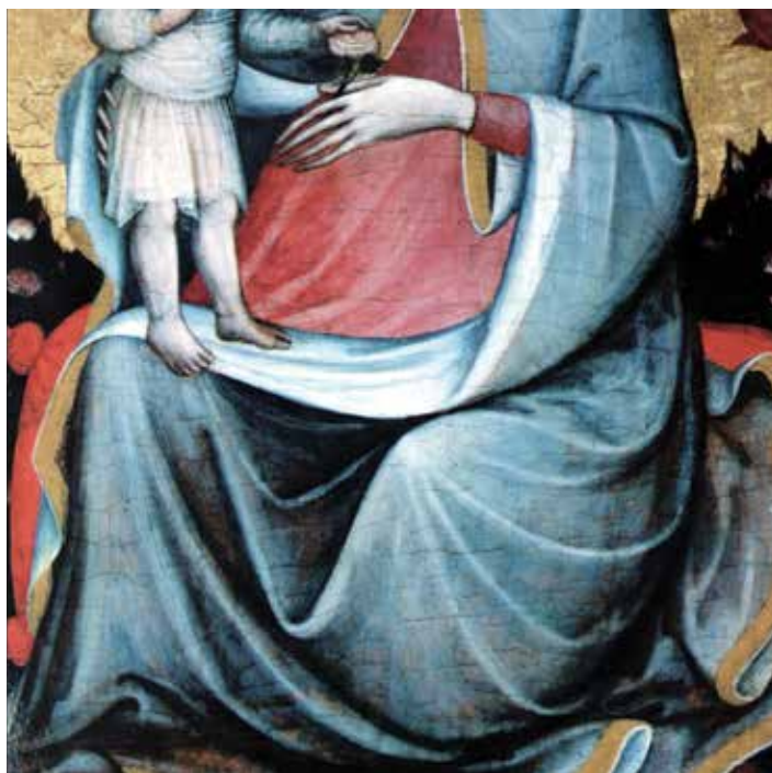
3. Nepoznati autor, Bogorodica s Djetetom , detalj crteža iz "Kodeksa biskupa Kosirića" (Šibenik, Samostan sv. Lovre) / Blaž Jurjev, Bogorodica u ružičnjaku (Trogir, Muzej sakralne umjetnosti)

Anonymous painter, The Virgin and Child, detail of a drawing from the "Codex of Bishop Kosirić" (Šibenik, Monastery of St Lawrence) / Biagio di Giorgio da Traù, The Virgin in the Rose Garden (Trogir, Museum of Sacral Art)