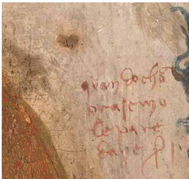
6. Menegelo Ivanov de Canali, zabilješka na poliptihu (London, National Gallery)

Menegelo Ivanov de Canali, note on a polyptych (London, National Gallery)