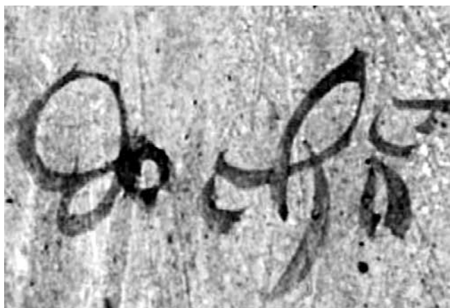
7. Blaž Jurjev, zabilješka na poliptihu iz crkve sv. Jakova na Čiovu, detalj / Menegelo Ivanov de Canali, zabilješka na londonskom poliptihu, detalj

Biagio di Giorgio da Traù, note on the polyptych from St James' church on Ciovo, detail / Menegelo Ivanov de Canali, note on the London polyptych, detail