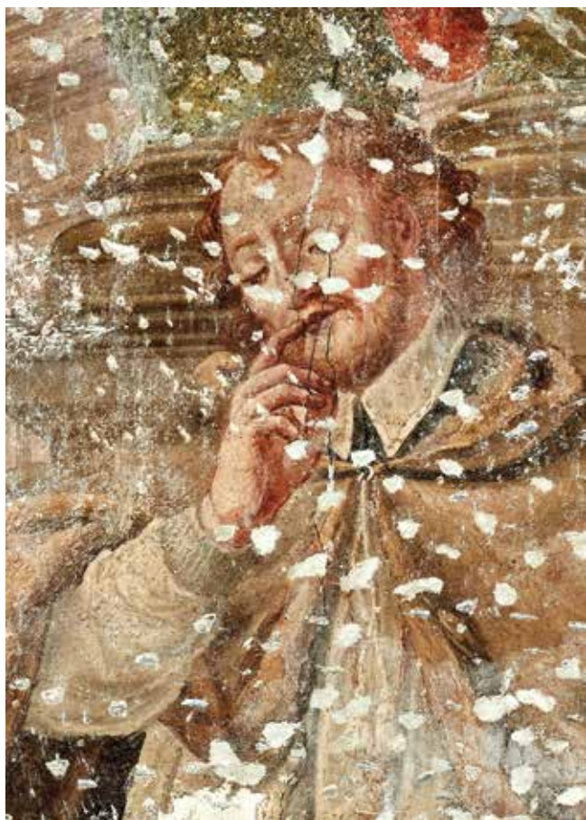
1. Franc Jelovšek (ovdje pripisano), Sv. Ivan Nepomuk pred kraljem Vjenceslavom (Václavom IV.) , 1749., detalj sveca. Karlovac, franjevačka crkva Presvetoga Trojstva, kapela sv. Ivana Nepomuka

Franc Jelovšek (attributed here), St John of Nepomuk in front of King Wenceslaus (Václav IV), 1749, detail of the saint, Karlovac, Franciscan church of the Holy Trinity, chapel of St John of Nepomuk