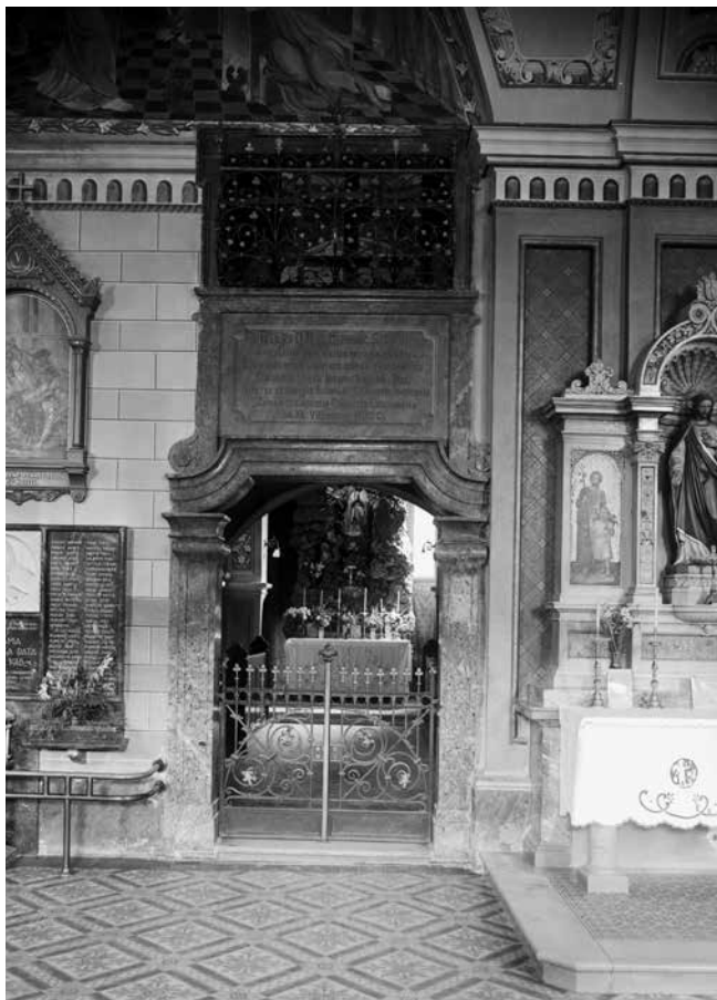
3. Đuro Griesbach, ulaz u kapelu sv. Ivana Nepomuka sa spomen-pločom, pogled iz lađe crkve Presvetoga Trojstva u Karlovcu, 1938., snimak iz Schneiderova fotografskoga arhiva, SFA-1276 (© SFA, HAZU, Zagreb)

Đuro Griesbach, entrance to the chapel of St John of Nepomuk with the memorial plaque, view from the nave of the church of the Holy Trinity in Karlovac, 1938