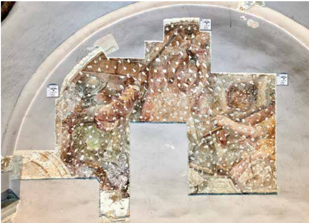
6. Franc Jelovšek (ovdje pripisano), Mučeništvo sv. Ivana Nepomuka , 1749.

Franc Jelovšek (attributed here), Martyrdom of St John of Nepomuk, 1749