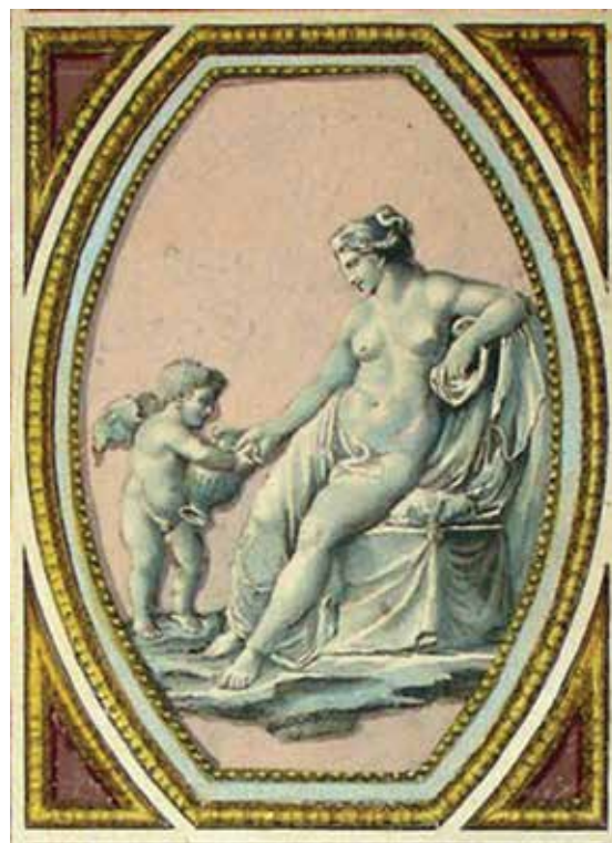
18. Giovanni Volpato, Venera s puttom i vrčem iz djela Logge di Rafaele nel Vaticano iz 1775. Giovanni Volpato, Venus with a putto and a jug from Logge di Rafaele nel Vaticano, 1775