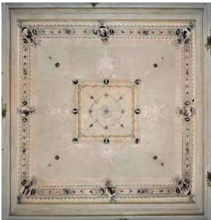
9. Svod zapadnog salona, Palača šećerane, Rijeka Vault of the western salon, Sugar Refinery Palace, Rijeka

kovanoj štuko-dekoraciji (sl. 9). Svod u zapadnom salonu sa zidnim oslikom arhitektonskih capriccia datiranima u 1789. godinu, omeđen je širokom trakom ispunjenom vrpčama i bokorima, a ona u sredini te u kutovima ima kružne medaljone obrubljene cvijećem i vrpčama. Na središnjem dijelu svoda nalazi se kvadratno polje dekorirano trakom s cvijećem i medaljonima, a u njegovom je centru ukras za vješanje lusteru omeđen spletom girlandi u obliku četverolista. Iz uglova kvadratnog polja dijagonalno se spuštaju vrpce ukrašene kopljima i medaljonima tvoreći tako četiri polja s kompozicijama sastavljenima od vojnih trofeja. Ljupke i gracilne grančice te girlande i bokori cvijeća vezani vrpčama posve su zamišljeni u duhu rokokoja, a taj dojam dodatno pojačava njihova polikromija izvedena u suglasju svijetlih zelenih, plavih, crvenih te žutih pastelnih tonova. Kontrast tim ukrasima pružaju medaljoni poput antičkih kameja ispunjeni bijelo bojanim reljefom naspram tamne kestenjaste podloge (sl. 10). U većim medaljonima slikarskom su lakoćom izvedeni fantastični krajolici i arhitektonski capricci s ruševinama, mostovima, kulama, a na jednom je prikazana i erupcija vulkana (sl. 11) Nije naodmet napomenuti kako su ondašnju Europu fascinirale erupcije Vezuva između 1764. i 1779. godine te da je ta dramatična prirodna pojava ostala zabilježena, ne samo u znanstvenim krugovima nego i u brojnim grafikama i slikama (sl. 12). 31 U manjim su me-