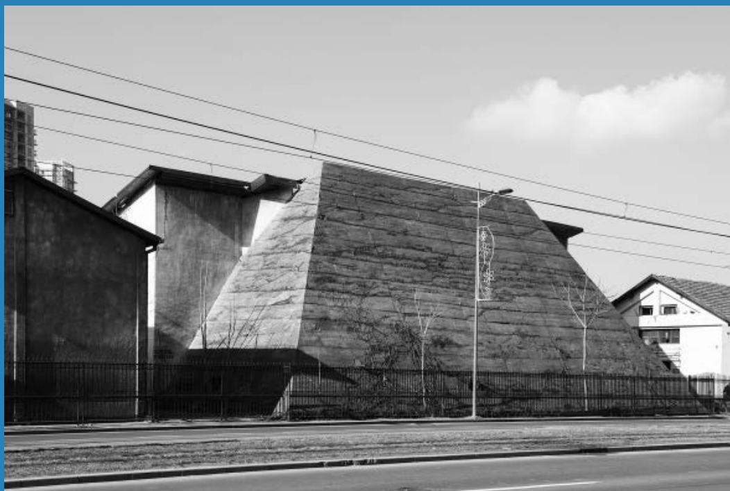
Crnobijele fotografije / b/w photos: Julia Gaisbacher, One Day You Will Miss Me ↑ →