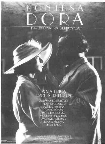
"Kontesa Dora" / "Countess Dora"

Možemo zaključiti da se filmskom plakatu u našoj kinematografiji ne posvećuje dovoljna pažnja, što je velika šteta, jer je plakat nedjeljni dio filmske promocije. On često prvi uspostavlja kontakt s promatračem i potencijalnim gledateljem. A da i naši oblikovatelji plakata mogu dobro obaviti posao, pokazalo se prije, pokazuje se donekle i sada, a svakako je potrebno da se pokaže i ubuduće.