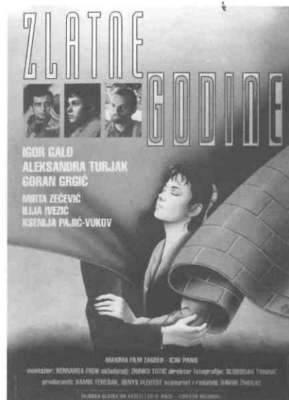
"Zlatne godine" / "The Golden Years"

Možemo zaključiti da se filmskom plakatu u našoj kinematografiji ne posvećuje dovoljna pažnja, što je velika šteta, jer je plakat nedjeljni dio filmske promocije. On često prvi uspostavlja kontakt s promatračem i potencijalnim gledateljem. A da i naši oblikovatelji plakata mogu dobro obaviti posao, pokazalo se prije, pokazuje se donekle i sada, a svakako je potrebno da se pokaže i ubuduće.