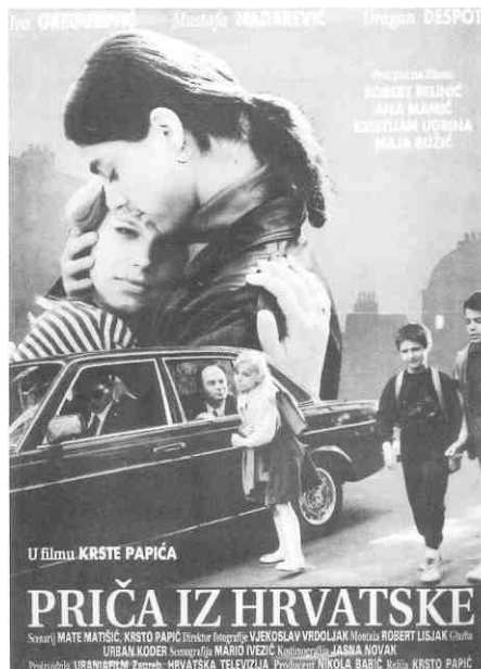
"Priča iz Hrvatske"/ "A Story From Croatia"

Dругu je vrstu plakata za ovaj film oblikovao sam redatelj Tomislav