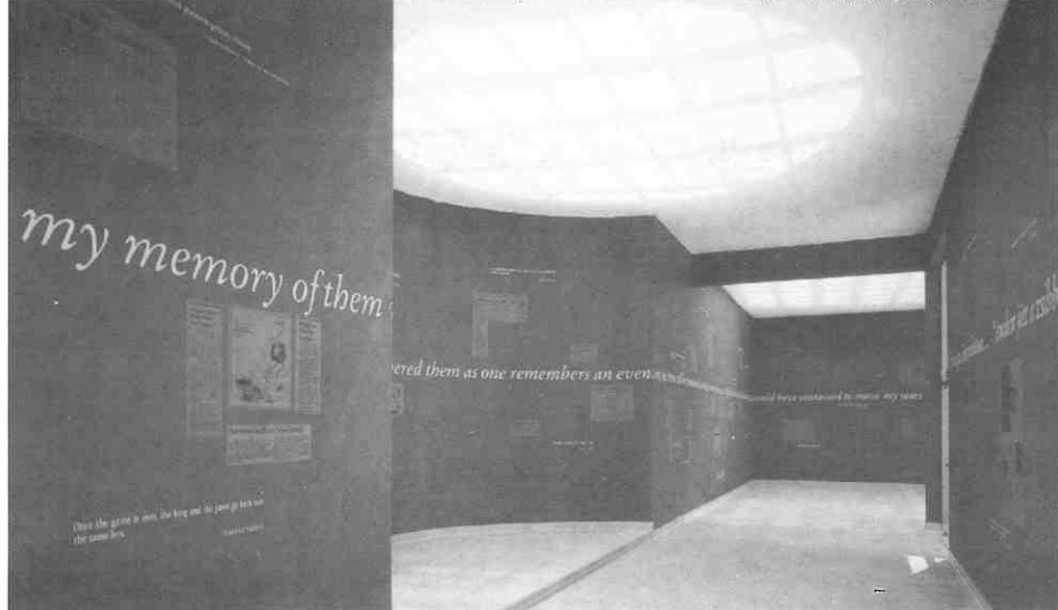
Joseph Kosuth, Zenon na rubu poznatog svijeta, 1993./Joseph Kosuth, Zeno At The Edge Of The Known World , 1993

Kosuthov postupak, problematizirajući sam pojam jezika (i onoga slikovnog), pokazuje njegovu artifičijelnost, izričući još jednom poznatu činjenicu da kao društvena bića postojimo samo unutar jezika i njegovih pravila. "Ako se glavnom aktivnošću umjetnika podrazumijeva stvaranje značenja, onda je kontekst neposredan