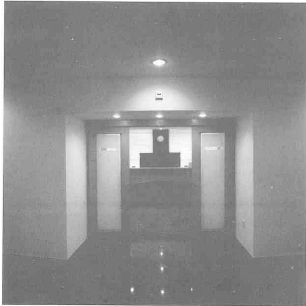
Čakovečka banka, 1994.

Tlocrt je slobodan i svojim prožimanjem pojedinih elemenata otkriva jasnu modernističku inspiraciju. Naravno, u najpozitivnijem značenju tog pojma. Istovremeno, ova osnova relativizirana je promišljenim komponiranjem središnjeg, otvorenog prostora sa zatvorenima, smještenim u obodnom dijelu stana, što omogućuje njihovo međusobno povezivanje i odjeljivanje. Najava prostornog koncepta stupnjevanih volumena prisutna je zapravo već na samom ulazu, gdje dvojnost javnog i privatnog, otvorenog i zatvorenog ima