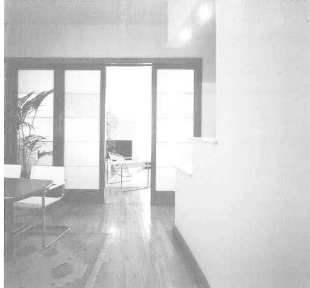
Interijer stana "G", Zagreb, 1993. Pogled iz blagovaonice prema ulazu

Od takve su vrste i radovi arhitektice Amire Čaušević, čiji interijeri svojom nepretencioznom kreativnošću već na prvi pogled otkrivaju autentičnu architecture parlante koja želi i uspijeva komunicirati svojim prostornim oblicima. Tom izazovu oblikovanja interijera u kojem će ljudi živjeti, raditi i boraviti osjećajući se ugodno, autorica pristupa s polazišta suprotnih svakom kvaziintelektualističkom prenemaganju i ispraznim pomodnim manirama, a rezultat je sretan spoj intuitivnog i racionalnog, ekspresivnog i funkcionalnog. Neovisno o tome da li je riječ o prostorima privatne ili javne namjene, u projektima Amire Čaušević koji čine opsegom nevelik, ali cjelovit opus, s odlikama prepoznatljive autorske osobnosti, strukturalni koncept ujedno je glavna spona ideje i formalizacije i dekorativni element koji se neopravdano u površnim interpretacijama nalazi među marginalnim aspektima dizajna.