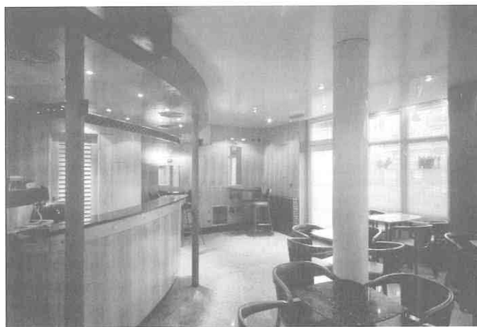
Cafe bar "Prince", Sesvete, 1994. (autor suradnik: Nataša Škarić)

The challenge of creating interiors in which people can live, lounge, work, and feel comfortable, is met by the artist without any pseudo-intellectual pretension or fashionable trendiness. The result is a happy combination of the intuitive and rational, the expressive and the functional. Regardless of whether she is designing interiors for private apartments or public premises, Amira Čaušević's oeuvre, though not large, is coherent and marked by her distinctive personal style. In its structure is the principal concern, linking the idea with its formalization. It is marked by a strong decorative quality, so often unjustly marginalized by critics.