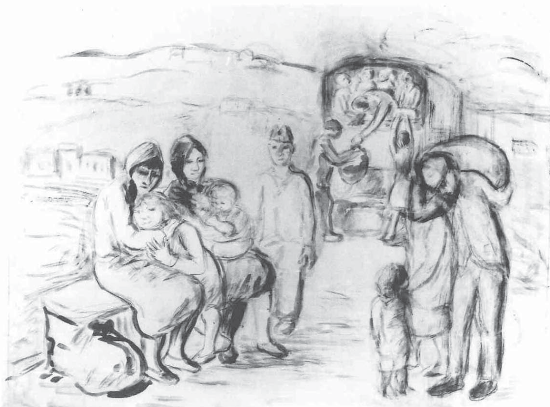
Oskar Herman, Zbijeg u Italiju, 1944. / Oskar Herman, Emigration to Italy, 1944