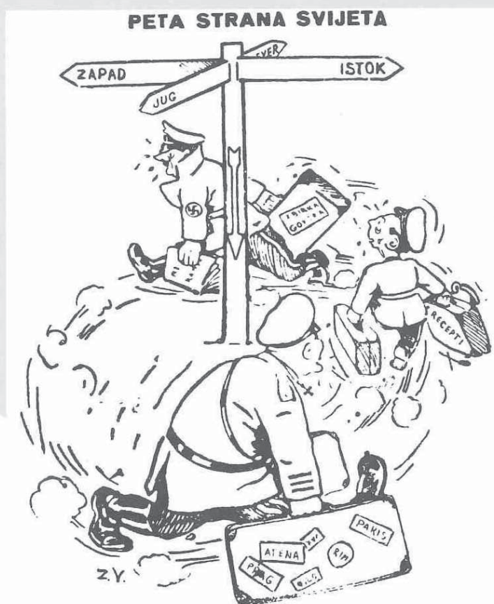
Zdenko Venturini, Omladinski borac, karikatura, 1945. / Zdenko Venturini, Omladinski borac, caricature, 1945

nja, a dalje bismo takvim pristupom mogli razaznati stilske oznake bauhausovske tradicije na djelima Rudolfa Bunka ili čvršći kiparski pristup na djelima Mirka Ostoje, Belizara Bahorića i Nikole Kečanina.